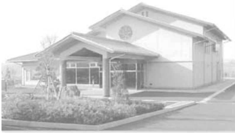
須坂市の斎場 松川苑

村長 北部組合としては現在の段階では安いコストで建設する事と、周辺の公園化を計画している程度である。