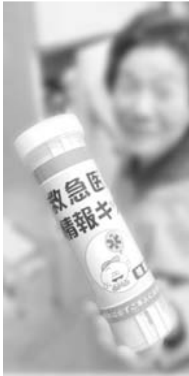
緊急時に役立つ救急医療情報キット

のは、自宅で具合が悪くなった時など救急隊員等に情報がすぐ伝達できるためのものでかかりつけ医や薬剤情報、本人の写真、健康保険証等を専用の容器に入れ冷蔵庫に保管するというものである。実施している所での評判は良いようだが、村としては今後の検討課題とする。