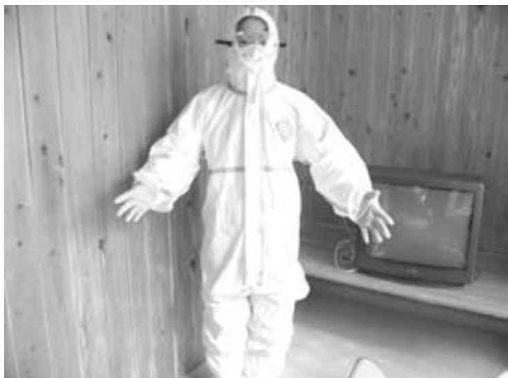
村で購入した防護服(鳥インフルエンザ用)

質問 国の経済危機対策にも、盛り込まれていたが、具体的な対応計画、情報の収集、薬品、防護用具などの備蓄等現在の対応はどの程度進んでいるか。