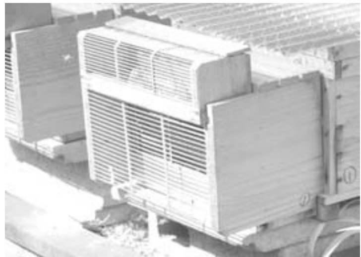
ミツバチは受粉作業の大きな助人

質問 ここ数年ミツバチ生産農家も少なくなり受粉用のハチの確保に苦労している聞き、ハチ農家への葉代、借り入れ農家への農業振興費による補助はできないか。