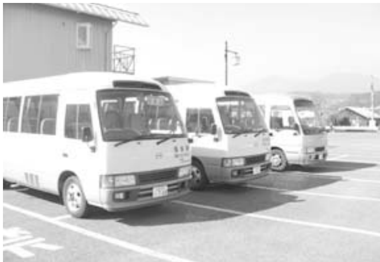
今日も快調「あきバスは行く！」

今度の総選挙で政権が変わり、「国民に顔を向けた政府にする」と公言しています。この「白タク案」を国交省や官僚に迫る絶好のチャンスと 法規制は厳しいと思います 国に対して強烈に、こんなことは出来ないのかと相談や申し入れをして頂きたいがどうでしょうか。