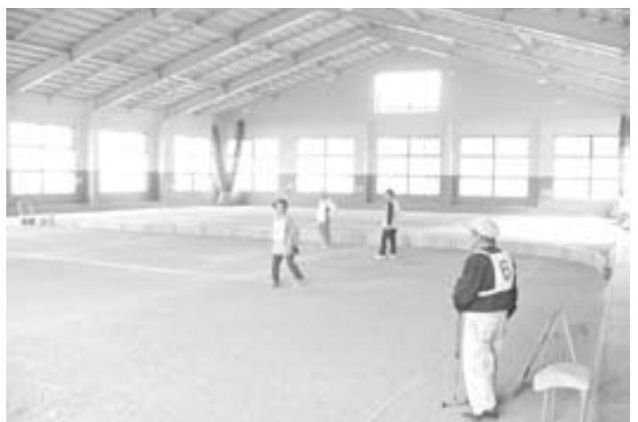
比較的使用頻度の高いスポーツ館

五月、月例の社会文教委員会の席上、直接豊丘村ゲートボール連盟より、「スポーツ館の使用料を、ゲートボールについてはメンバーも高齢者であるということを加味して、無料にしたいので、理事者、教育委員会への働きかけも願いたい。」旨の要望を受けた。