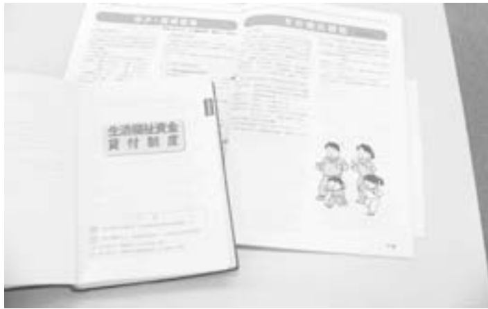
一定のルールは必要

質問 生活困窮者や障害者に対して、緊急に貸し出される制度、豊丘では「暮らしの資金」（村社協）十万円限度であるが、今回国の法律が変わり今まで無利子で借りられるが連帯保証人が必要だった。制度変更で簡素化され、有利子なら保証人無しでも借りられるようになった。全国的にそういう自治体も増えているようだ。実態は明らかに借りる人も増えている。借りる人に