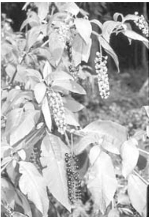
脅威の雑草 ヨウシュヤマゴボウ

質問 脅威の雑草（ヨウシュヤマゴボウ）の駆除を広く村内外へPRし、積極的に取りくまれないかどう考えるか。 産建課長 環境課と連携し広報等を利用しPR等行うよう考えている。