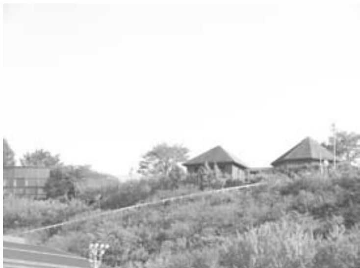
通称「セミナーハウス」の今後は？