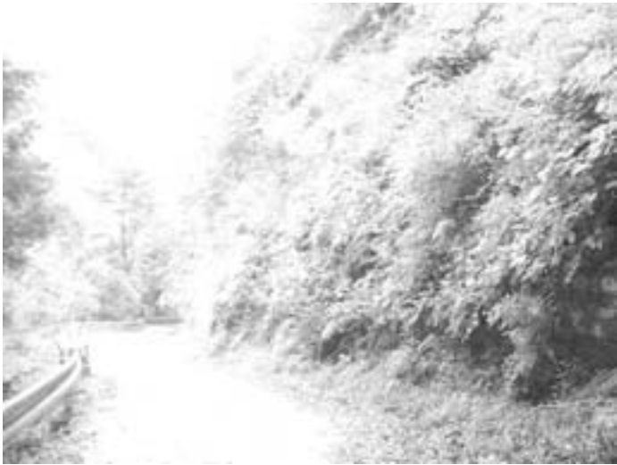
危険な大島虻川線（現在発注を見あわせている）

住民課長 基礎疾患については、国民健康保険加入者は把握できるが、それ以外の保険加入者については相談に來られれば分かるが、そうでない方はわからない。検討する必要がある。感染家庭について一人暮らしの方については対応が必要と考える。