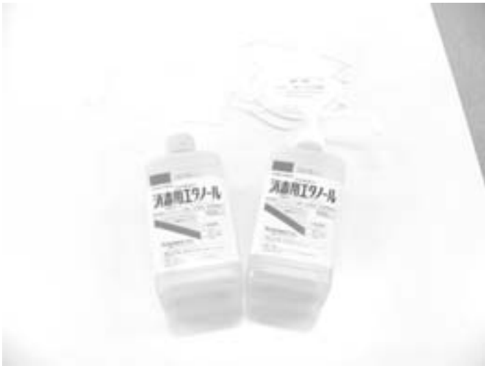
手洗い、うがいが大事