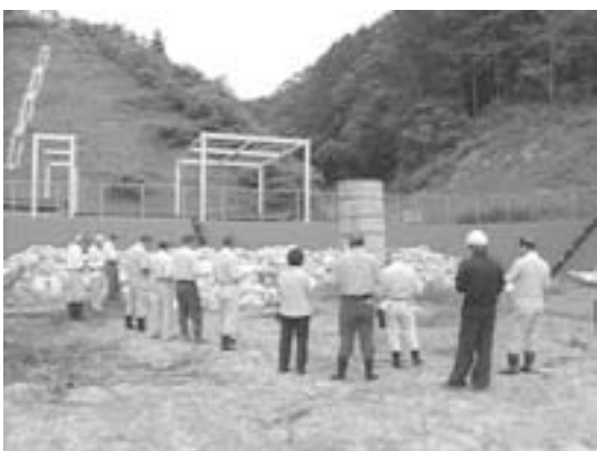
北の沢一般廃棄物処分場現地視察から

搬入された袋の中は、埋め立てゴミのみでなく、プラスチック、ゴムなどが混然とした物も。これらはごみゼロ運動の収集物で、