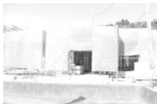
繰越事業としての神稲児童クラブ建築