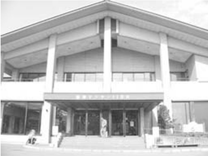
広域行政の強化も

る。まだ見えない部分が多いが、広域連合とのよい活用を望む。難題山積の地方自治の課題に対し、市町村合併、道州制、県による事務の補完など様々な模索があるが、当地方ではまず広域行政。リーダーに危機感と強化拡充の努力を求めたい。村長 その通りでそのつもりである。