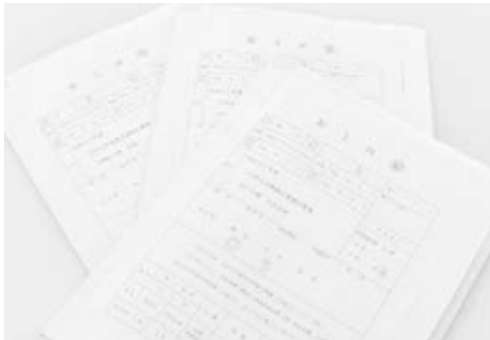
村内業者の受注拡大を

質問 長引く不況で建設業や建築業者の経営は苦境に立たされている。こうした中で公共事業の受注は業者の経営と労働者の生活を守るために大きな役割を果たすものである。村発注の公共工事の入札