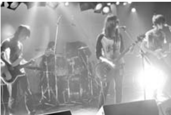
glim spanky のライブ

二人の共通点は、「デジタルよりアナログに才だ。」演奏、芸術技術など共通した物づくりの原点が存在するからだ。私とはるかに年齢差はあるが、一安堵の思いがした。十一月には飯田市でライブを行う予定。受験を控え多忙ながら、無限に広がる可能性に挑み又、村への熱き思いを語られた十代の若者にエールを贈り、取材を終えた。