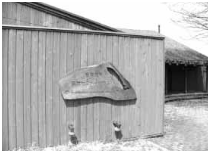
セミナーハウスに春は来るのか？

◎セミナーハウスの任命責任について 質問 セミナーハウスの管理委託について当初議会の中でも反対意見があったが村長はあえて委託をし現在裁判まで行っている任命責任はないのか。 村長 近隣の皆さん、農地を持っている方たちに迷惑をかけた事については申し訳なく思っている。