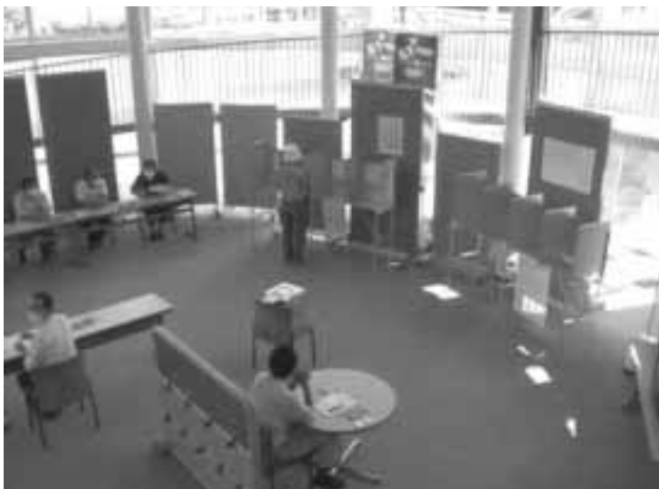
選管では諸課題を検討中だが投票率向上が最大使命

年に公職選挙法の一部改正がされ、二時間延長した経緯がある。又投票率の向上は選管にとって最大使命である。投票所合併については現在検討を進めている。変更による経費面でのメリットはあるので、今後も諸課題を検討しつつ、前向きに対応していきたい。 要望 国政レベル選挙等は期間も長くかつ、開票も繁雑となる為、投票時間の繰り上げを要望する。