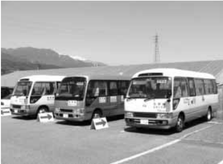
デマンド等先進地視察も検討する方向に

質問 私は昨年の一般質問で空気を運んでいる結果にならないか、専門のコンサルタントに調査委託して計画を立て