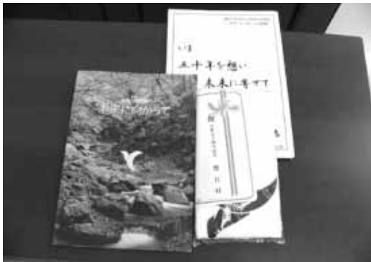
飛躍の一步となるか村勢要覧

質問 村はリニア中央新幹線飯田駅設置にどのように関わるのか。JR東海は駅設置には三百五十億円程度かゝるとし、建設費用は全額地元負担を求めている。村は今年度予算に、リニア中央新幹線飯田駅設置基金の造成として、八十六万余円を盛っている。この基金の意図することは何か。考えを伺う。