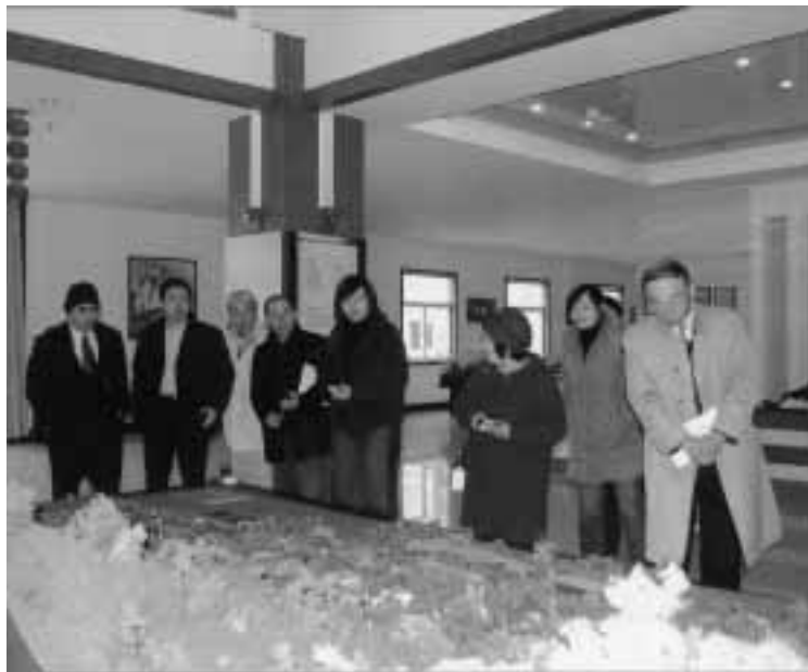
壮大な開発計画の説明を聞く一行

四日目は、上海ヤクルト有限公司の視察。二千年に中国に進出し、日量九十万本を生産している。従業員百名、週休二日制、平均給与五十元。中国でも健食ブーム。今後天津に新工場建設予定で、中国全土で販売する計画と聞く。世界中の企業ほとんどの業種が中国進出をしており中国の総生産額をより押し上げている感がした。