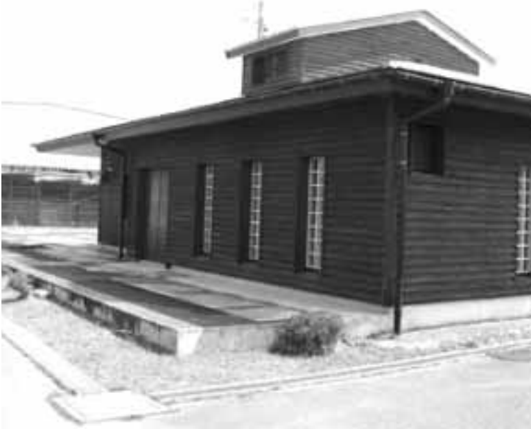
H22、23年度機能改修工事が行なわれる伴野農集排処理場

教育長 五十名を有する規模から、学級編成上や、生徒間の学ぶ所が多い。又中学校には生徒指導の先生を配置してもらっている。