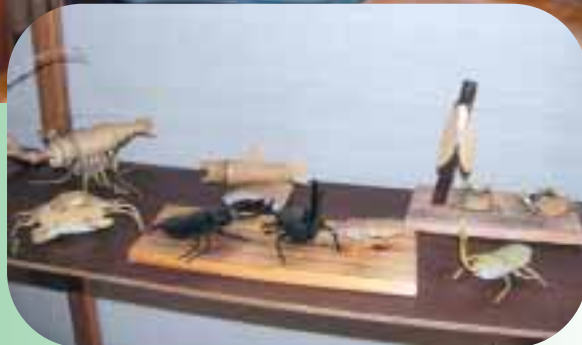
匠の技 竹細工 さかお 五味榮雄さん(北垣外)