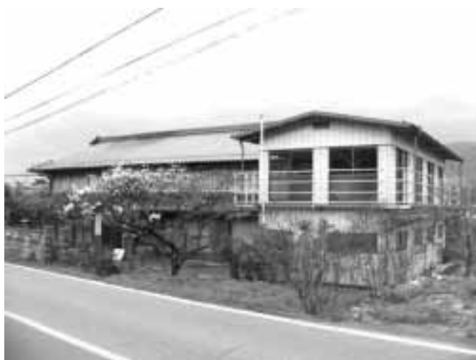
中芝の宅地予定地

村と議会の深い議論と、議会の理解がないままに行なってはならないとする強い意思が議会側から示されたもので、事業執行を事実上凍結とした。 これには、宅地や住宅供給の必要性や、税投入の在り方について、村の考え方とのずれもあるからだ。