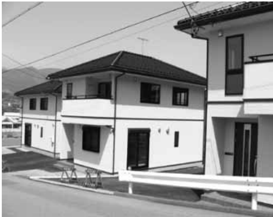
第4弾人口増対策 林里の賃貸住宅完成

丸岡議員 人口対策なら解るが村が出血サービスする必要はない。広く住民に理解されるべきだ。