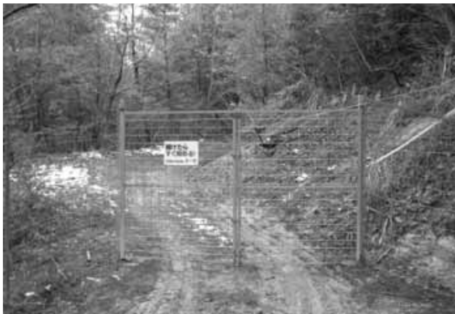
管理がむずかしい！フェンスを張ったが… (上久堅)

産建課長 二十二年度に委員会を立ち上げるがまだ最終的には委員の構成は決まっていない。現在有害鳥獣の対策協議会がありそのメンバーに含めて各地区、あるいは利害関係のあるマツタケを採られる方も入っていた、きながら検討していきたいと思っ