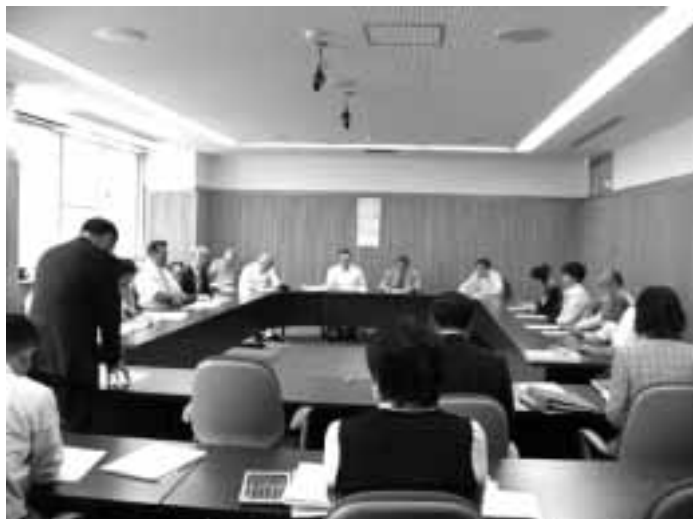
国保運営協議会での審議の様子

村長 ①医療費の動向、歳入の状況等見通しが立たない部分であり、今のところは基金を取り崩して収支の均衡を