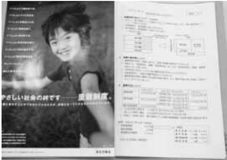
広く里親制度の理解を深める

住民課長 福祉係の子育て支援専門員が児童相談所とつなぎをしているので、役場の入り口等に表示するように検討していきたい。