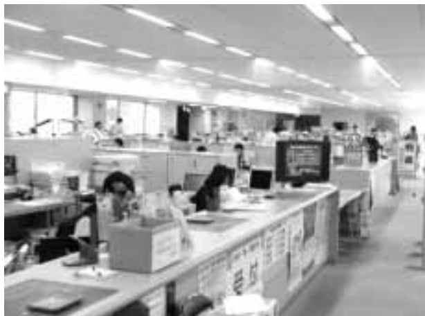
広すぎて電気料が「モッタイナイ!!」

村長 職員給二%下げた代わりに時間短縮ということで、八時間あったものを七時間四十五分の実労働時間にかえた、間違いはない。