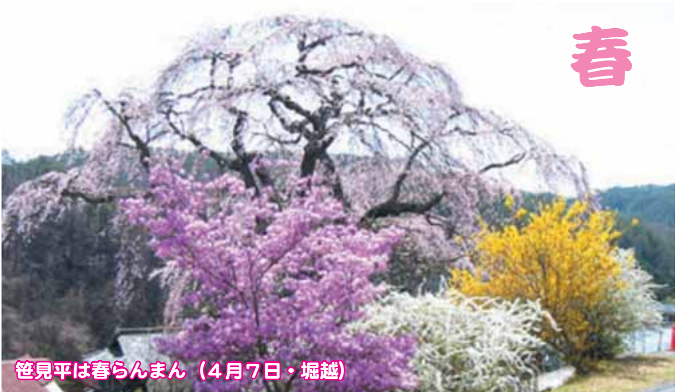
笹見平は春らんまん（4月7日・堀越）