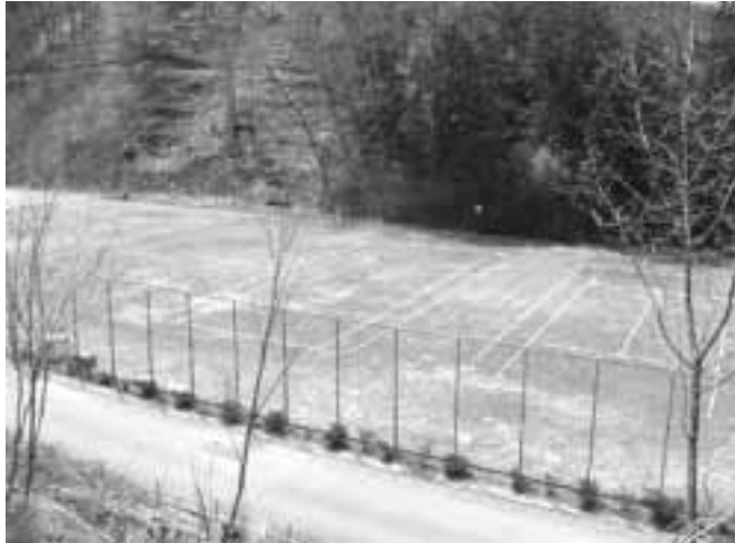
賛否両論、テニスコートの今後は