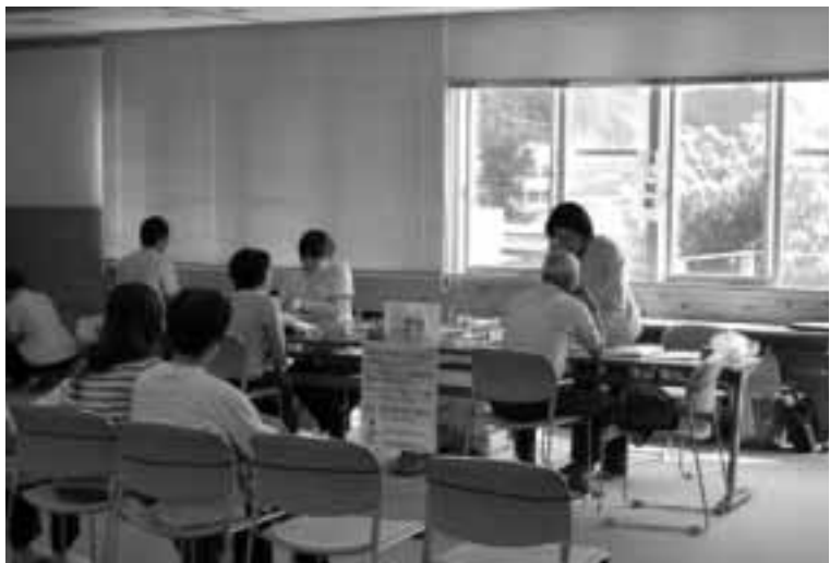
ヘルスクリーニングの様子