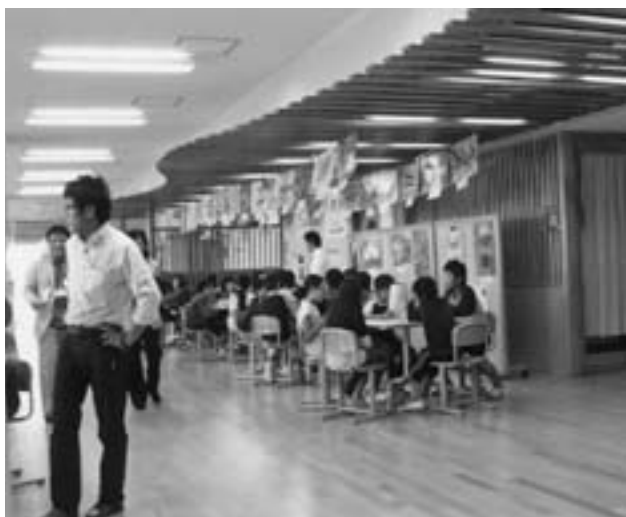
開放感あふれる豪華な教室

初日は富山市立中央小学校を視察した。市内三校を統合し四百人弱の生徒数に三十億円の豪華な校舎を建築した。市内の生徒数の減少に歯止めをかけると共に、ESD教育（環境に配慮した持続可能な開発のための教育）を生徒に対して行っている。二十二年度は、一学年「なかよし、いっぱい」公園で自然と親しむ。二学年「ともに生きる、見つけよう、育てよう、ふれ合おう」一人一鉢の野菜を育てる。三学年「発見、発信、中央小探検隊」老舗や寺、神社廻りの中で地域を学ぶ。四学年「レッツゴー