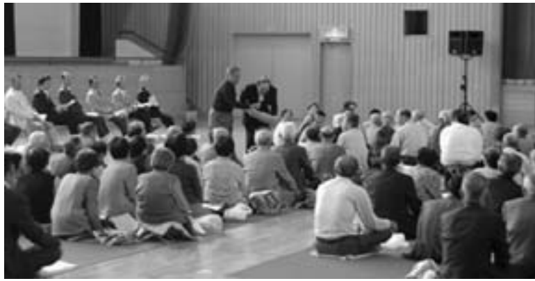
多くの人が楽しく集える敬老会を

要望 国では市町村に1/2の負担を求めているが二年間の特例措置という事なので恒久的な制度にして頂く事を求めて頂きたい。