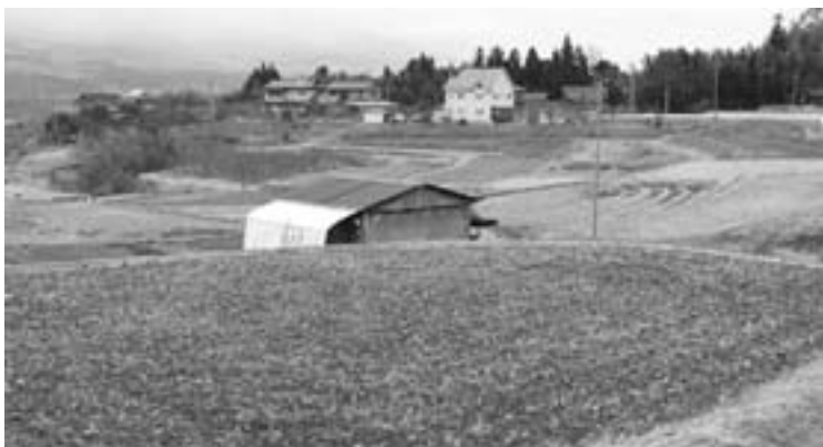
中央アルプスを望む田園 (木門地籍)