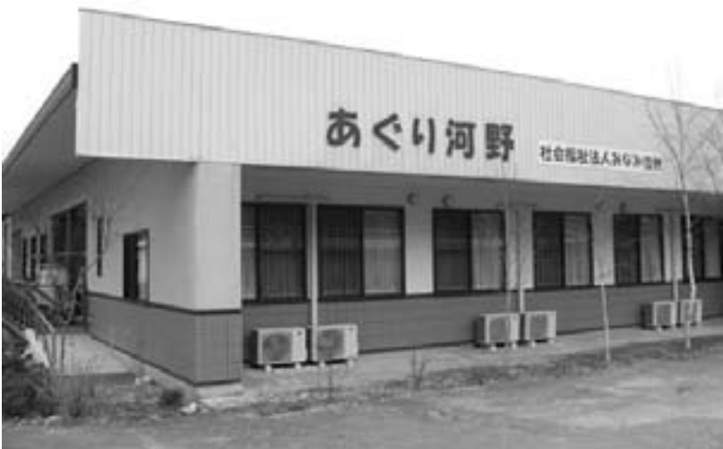
増床計画もあると聞く「あぐり河野」

乱を招いたことについておわびをし、今後の候補地選定についても御理解をいただきたいと考えている。 質問 一日も早く火葬場が欲しいという声に対してどう考えるか。 村長 大勢の中で民主的議論をし方向性を決めるのが大切と考える。