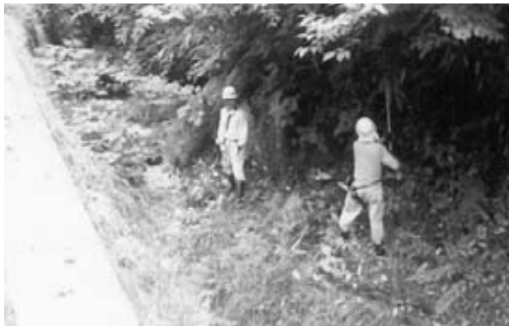
河川管理も大きな負担に

下段にはかなりの大金をかけている。山間地域からの若者の流出を防ぐよう、住宅のリフォームなり新築なりの援助をすることによって、若者定住の対策を行ったらどうか。 村長 一昔前までは行政と個人のかかわりの問題があったが、こうした課題がある場合は行政で手を差し伸べる時代と考える。