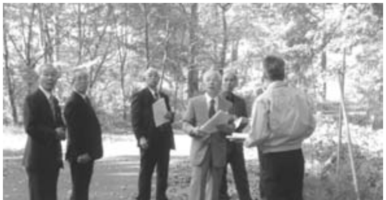
張りめぐらされた防護柵を見る

次の日の視察は「鳥獣害対策」「移住、定住政策」で同じ北海道の「厚真町」。まず役場庁舎内でレクチャーを受けた後、現地の見学。北海道には猪はいなくて、エゾ鹿の被害防止のためにネットが張り巡らせてあり、町自