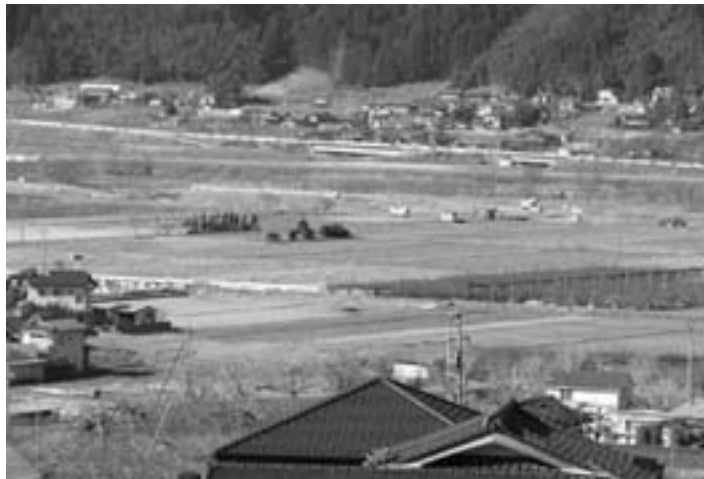
TPP参加は村にとってマイナス影響

質問 現在の経済悪化はその先で子ども達の貧困があり重大な社会問題となっている。親の収入によって教育に大きな格差が出ているとの調査もある。行政としてもこの問題には熱心に取り組み必要がある。その中で収入のない家庭への就学援助は国基準による要保護は生活保護が基準になっている。市町