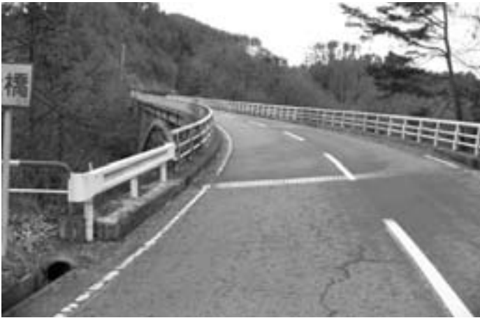
フェンス設置される虹川大橋

参加者が減少、新たな取り組み方を考える時期にきていると思われる。次年度から村の支援体制のもとで各地域で実施すると聞く。方向としては？ 村長 年々減少していて寂しさを感じる。担当課で検討する。 住民課長 高齢者の集まる機会を多く作っていく中で敬老会について検討を加え実施し、これからも各区へお願いして行きたい。