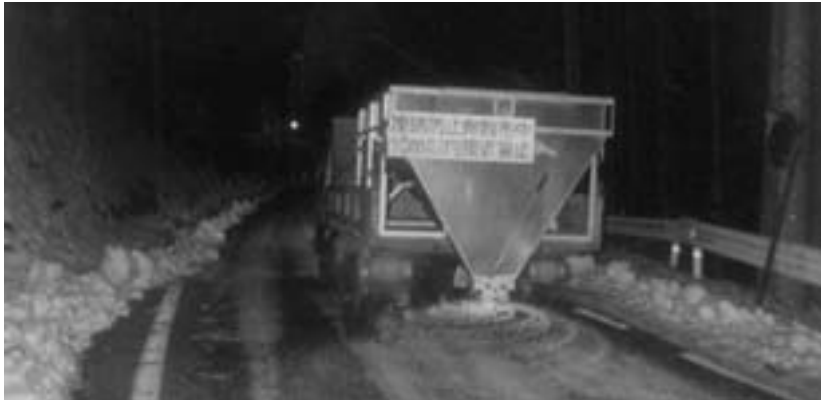
早朝より稼働する塩カル散布車