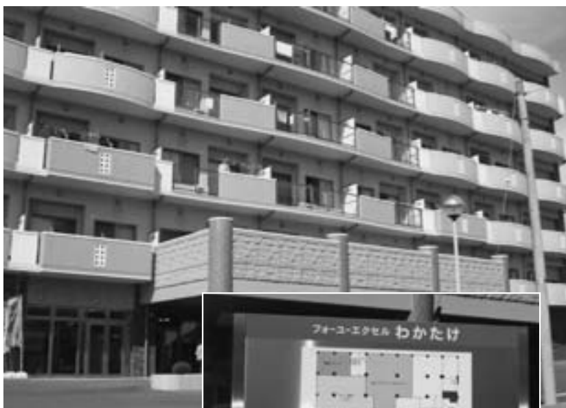
家賃補助はあるが 高額な入居料が必要 優良賃貸住宅

ビス提供がされているのが特徴である。介護需要の拡大に伴い、保育園、デイサービス、特養をセットとした、四階建て施設を隣地に増設中であつた。