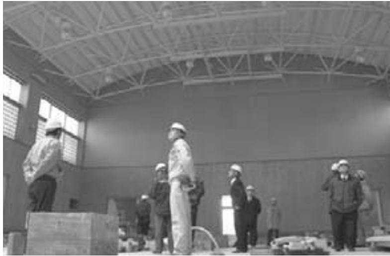
社会文教委員会 南小体育館を視察

よって、防災・生活関連公共事業予算の拡充と、地方出先機関を存続し組織・人員の確保等業務執行体制の拡充を求めるもので全会一致採択しました。