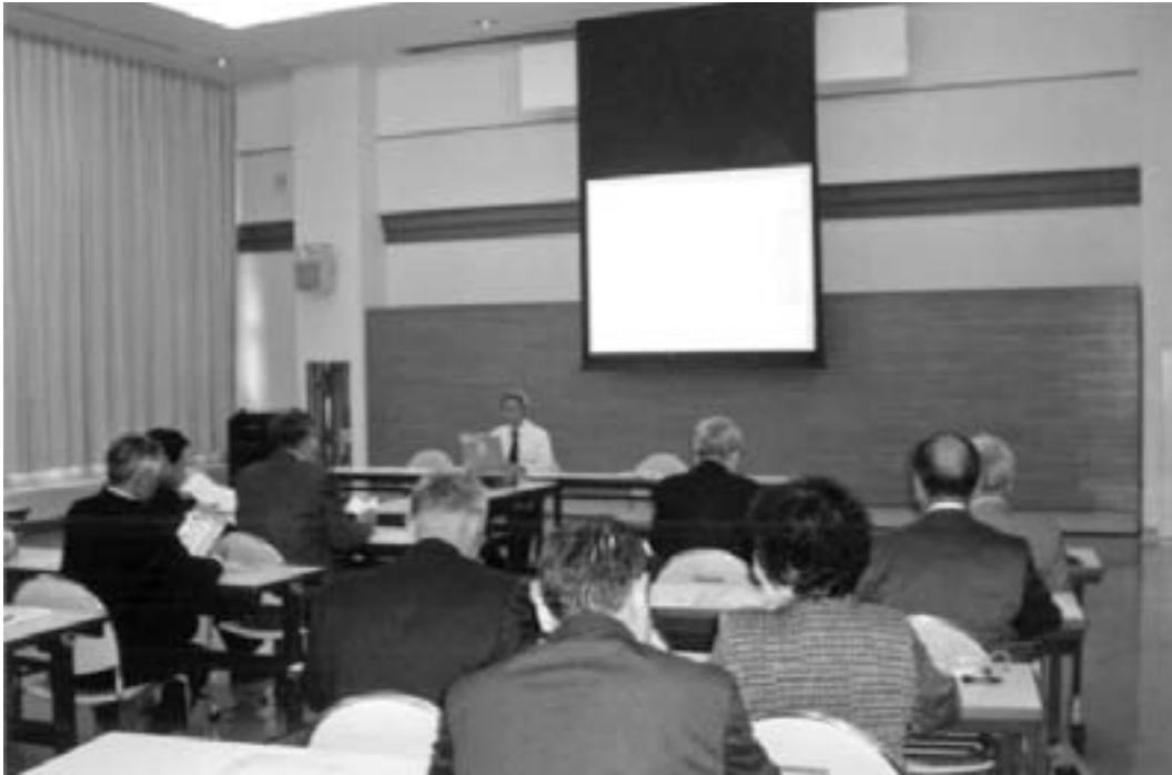
活発な質問攻勢の三市町村議員

私達が先進事例を学ぼうとする町にはそれ相応のわけがあるので行政視察が殺到する。先方指定の日時には、三団体三十八人が集結。「白老町」の町名はアイヌ語の「シラウオイ」から転化したもの、位置は北海道の南西、有名な「登別温泉」「千歳市」「苦小牧」の真ん中あたり。研修の主目的は「議会改革」で議会の概要、常任委員会の構成、議会運営委員会の構成、会派の構成、議会の開催状況、委員会の開催状況、本会議の審議状況、議会の予算、議員報酬、費用弁償、町の予算等について説明をうけ、質疑応答でたいへん良い勉強となった。 当村においても議会改革はまったなしで、議員定数、報酬、議会開催日数など問題は山ほどあり早急に議論すべきである。