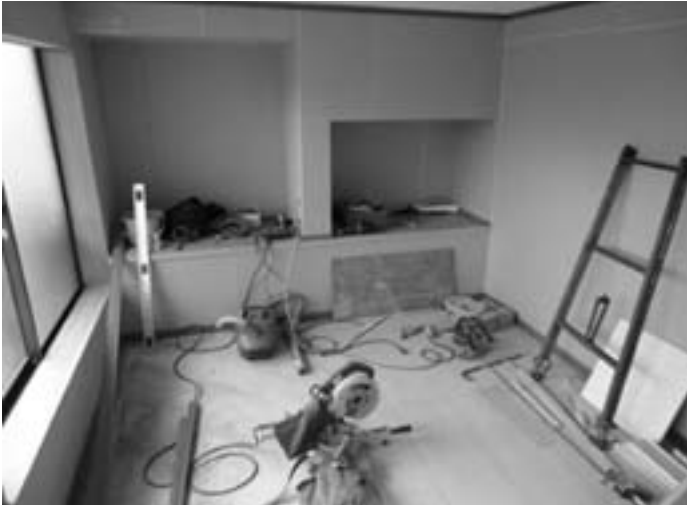
リフォームにも助成制度が必要

村長 厳しい経済状況の中で建築関連業者の仕事の激減には村としても対策を講じる必要があると考えている。後継者対策、生活上、経済等総合的な観点で「住宅リフォーム助成制度」も大切な施策であり、二十三年度から予算づけできるよう検討したい。