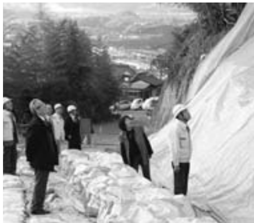
総務産建委員会 城地籍の災害を視察