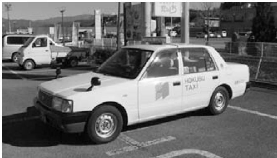
軽四で料金の安いタクシーはできないものか

すると思つたので、いま一步研究お願いしたい。火葬場も住民が早期の実現を望んでおり職員の高すぎる給料問題にも、住民の目線に立ちスピードを持つてやっ