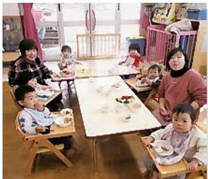
☆ばくばくモグモグ♪おおきくなあれ