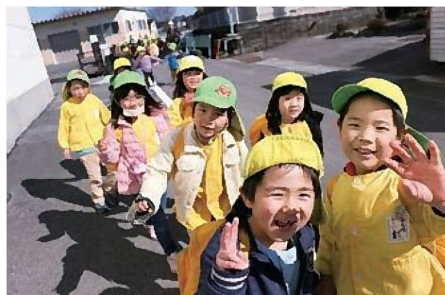
☆園ゆり組みんなでおさんぽ♪