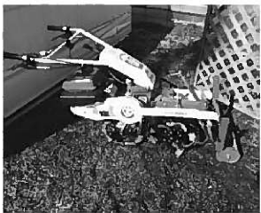
他にトラクター新調り機。