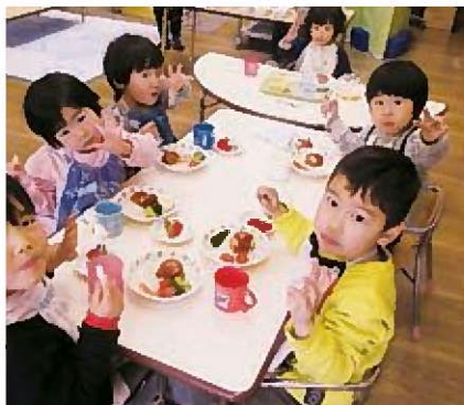
☆みんなで食べるとおいしいね♪