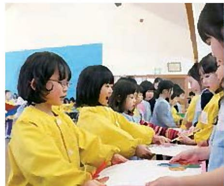
☆さくらさん仲良くしてくれてありがとう?