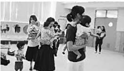
おかさんに抱っこされてリトミックを楽しんでいます。