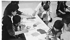
「自分でできるよ!」と制作を頑張るお友だち。