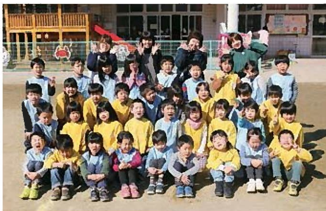
☆元気な一年生になります!