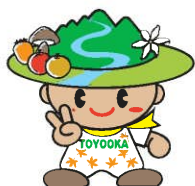
豊丘村キャラクター「だんQくん」