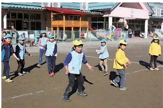
☆ドッジボール!当てちゃうぞ~!!