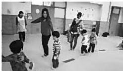
お友だちと一緒に歩いて歩く事を楽しんでいます。