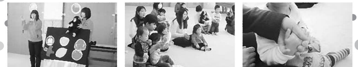
あか・きいろ・あおの信号の色 どんな意味があるのかな?

長野県交通安全支援センターの皆さんをお招きして、信号機の見かた・子どもとの手のつなぎ方などの勉強を体を使いながら体験しました。4月から保育園に通うお友達も交通ルールをしっかり守って安全に通ってくださいね。