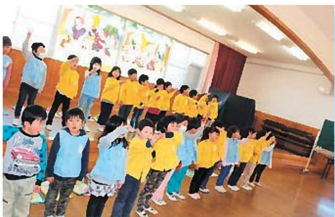
☆さくらさんの歌♪とっても上手でかつこいい★