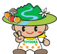
豊丘村キャラクター 「だんQくん」