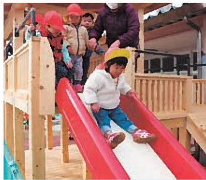
☆すべり台たのし〜い!