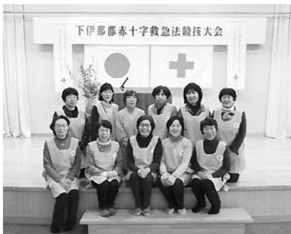
【参加した団員の皆さん】