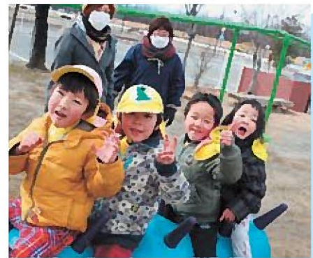
☆新しい遊具は楽しいね!