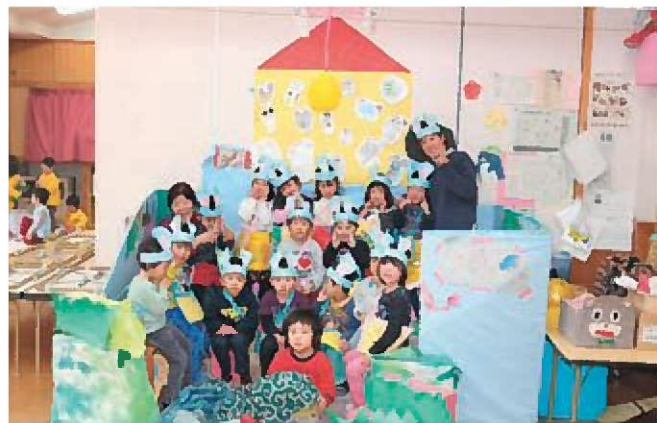
☆ねずみさんに変身!