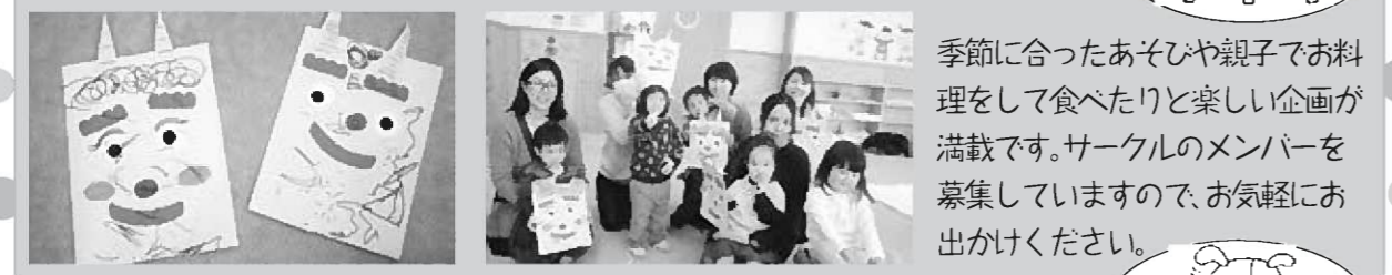
季節に合ったあそびや親子でお料理をして食べたりと楽しい企画が満載です。サークルのメンバーを募集していますので、お気軽にお出かけください。

豊丘村の就園前の子どもさんとママを対象にしたサークルです。一年間の楽しい企画を計画して、交流を深めています。この日は節分の日が近かったので、鬼のお面を親子で作りました。