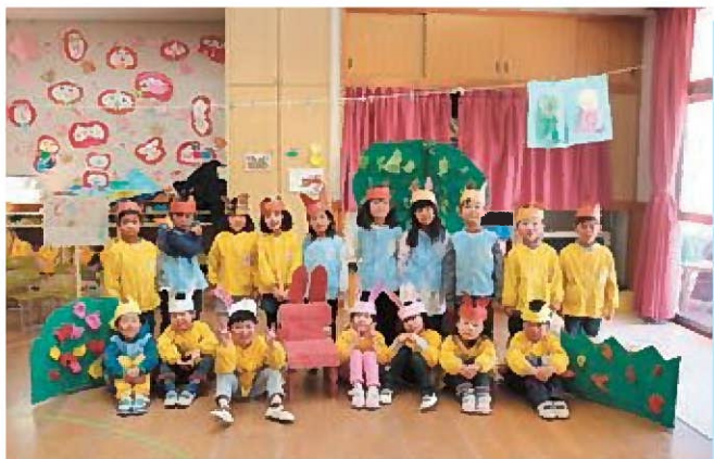
☆どうぞのいす、たのしかったね!