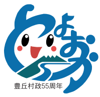
豊丘村ロゴマーク

●編集・発行● 豊丘村役場 総務課 企画財政係 〒399-3295 長野県下伊那郡豊丘村大字神稲3120番地 電話 0265-35-3311(代表) / FAX 0265-35-9065 ホームページ http://www.vill.nagano-toyooka.lg.jp 電子メール info@vill.nagano-toyooka.lg.jp