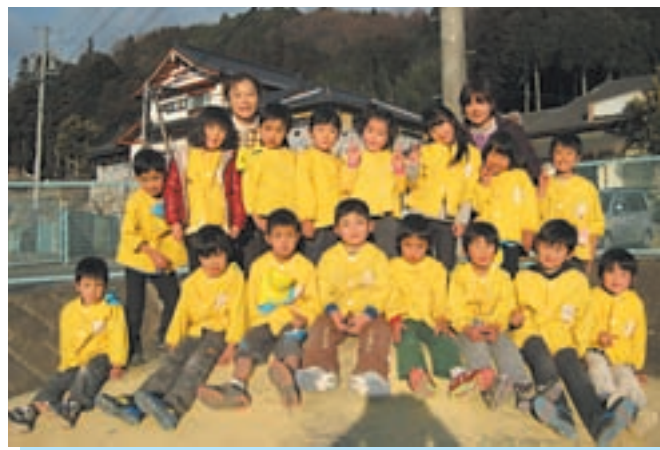
▲元気いっぱいさくらさん！あと少しの保育園生活 しっかり楽しむよ！！

◀ベツタンコ、ベツタンコ、おもちつきをしたよ！ 保育園で育てた大豆や小豆をきな粉やあんこにして一緒に食べたらおいしかった〜♪