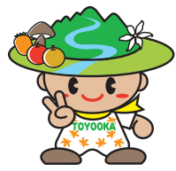
豊丘村キャラクター「だんQくん」