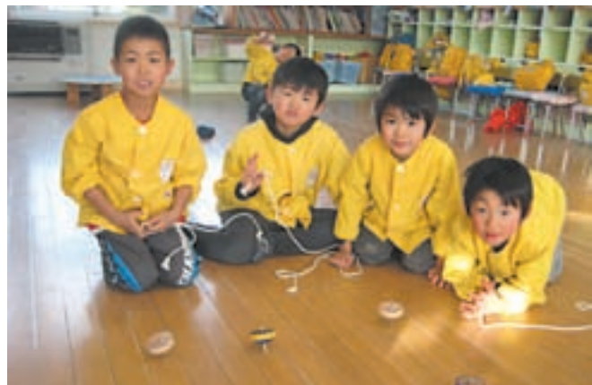
▲ヒモゴマに夢中です！いろんな技にも挑戦するゾー！！