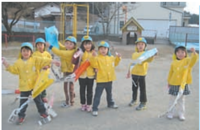
▲♪たーこ たーこ あ〜がれ て〜んまで あ〜がれ よく飛ぶたこだよ！