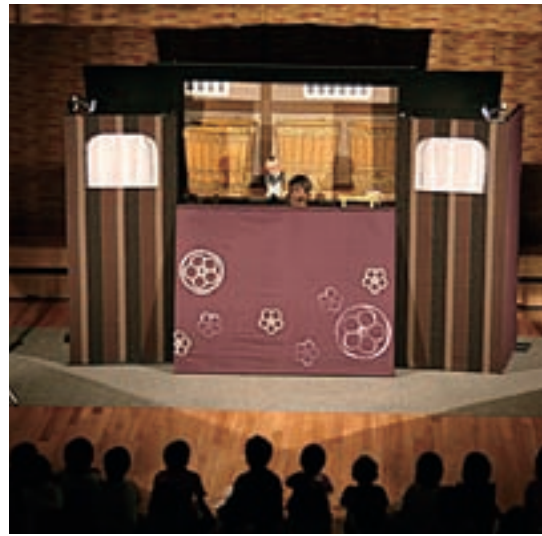
豊かな内容が演技者を通じ観客に

例年ですと、飯田市の人形劇フェスタの開催時期にとよおか公演も行なわれていたのですが、今年はなかつた為、残念に思っていたところ、九月末に開かれると聞き、子供達と心待ちにしていた。