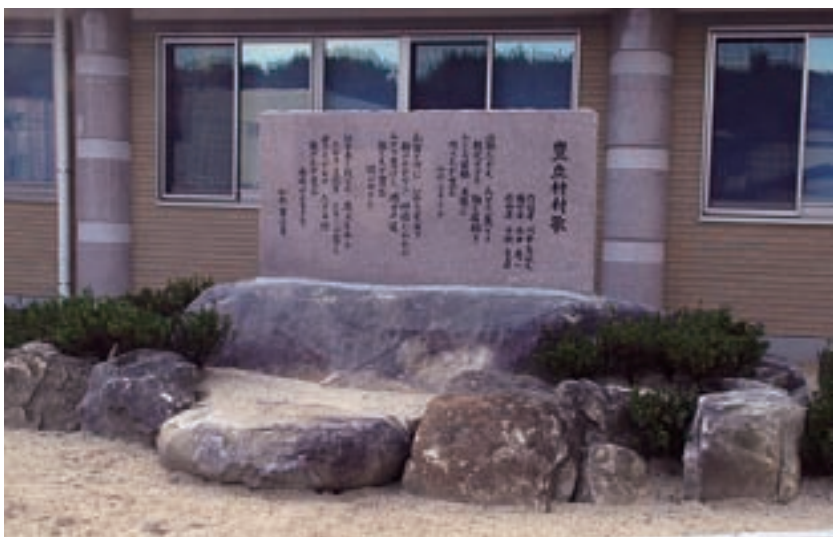
玄関傍らには立派な歌碑も寄贈されました

設置するスペースも無い』 以上のような理由から『予定どおりバリアフリー(土足禁止にはしない)で利用する』と結論となりました。ただし、利用する中で問題が起きた場合は協議するということとなりました。 教育委員会では、三年前にオープンし『ゆめあるこ』の設計のモデルにした豊科交流学習センターの視察を九月三日に行ないました。入り口の泥落としマット、こまめなモップ掛けなどの手入れ、年二回のワックスがけなどで、オープンから三年以上経っても驚くほど綺麗に維持されていました。