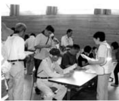
訓練での課題は次年度の改善につなげ

が達成したら解散する限定的なものです。役割を一言で言えば「被災者がなるべく早く元の生活に戻れるように災害ボランティアと協力して生活を支援すること」と「災害ボランティアが活動しやすいよう応援すること」です。