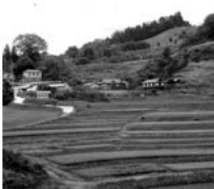
美しい棚田が復活