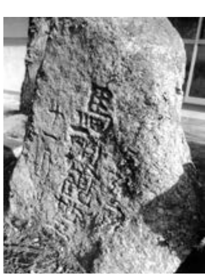
今も村内各所に馬頭観世音が