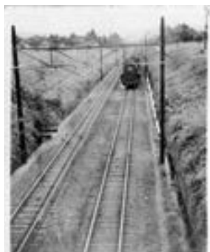
昭和30年代の東海道本線

岡崎は東海道本線の沿線に近く、掘割に陸橋があり、真上から四本のレール「複線」が真直ぐに伸び、そこを客車は無論、貨物列車が何十両も連ねて通っていた。上下線がすれ違う光景は、時の経った今でも鮮明に脳裏に刻まれている。