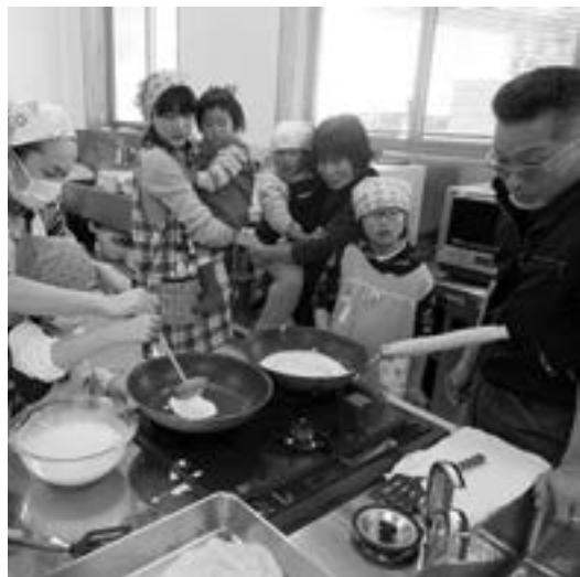
上手に焼けるかな？

小学生や保育園児など小さな参加者にとっては、包丁や火を使う料理は興味津々だったようです。中火で温めたフライパンに生地を入れ、神妙な顔で見守る子どもたち。生地が表面がプツプツしてきたらひっくり返します。何枚も焼いているうちにだんだん面白くなってきたようで、順番が待ちきれない様子でフライ返しを握り夢中になっていました。「スープもできあがり、みんなて試食。食材を手で巻いて食べるという食べ方も食事を楽しませてくれます。参加者の感想は？」