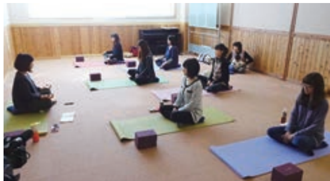
ママ講座は話題のリラックスヨガを体験

に参加しました。この講座 はパパ講座とママ講座の二 本立てとなっています。マ マ講座ではリラックスマ マ講座を体験しました。ヨガとい うと複雑なポーズをするよ うなイメージを持つ方も多 いと思いますが、リラック スヨガは心地よ く感じる姿勢で 行います。アロ マの香りを楽し みながら心身と もに癒される時 間となりました。 パパ講座では広 い部屋で思い切 り体を動かすこ とができ、親子 で楽しめたよう です。家での遊 びの参考になり ました。普段は 子どもと過ごす 時間が多い中