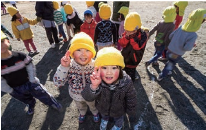
輝くスマイル 園児が朝の光の中、寒さも気にしないで集まって来た

待ち、そして子どもの世界 にズッポリ入り込んで行く 自分が居るのです。風景で は無駄を極力排した構図と して、見やすく美しいもの を発見しながら臨みます。 今も、更にこれからも生 涯テーマとしているものに 青(藍)という色の追求が あります。色彩の豊かな中 で唯一心休まる色と考える からです。気負わず焦らず 青の持つ魅力を探して歩 ゆつくりと時間をかけて。 これが自分探しの人生と考 えています。