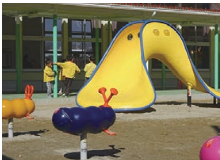
インパクトのあるデザインが子どもたちをひきつける

は、中心の棒との距離によって、回転スピードが変化する。子どもたちは数人で乗っては、スピードを確かめている。 極め付きは築山だ。「作りかけ？」と思ってしまうような、土がむきだしのままの山。登る時には足腰が鍛えられ、頂上からは三輪車で駆け降りる。その制御不能なスピードを楽しむ。なかには、シャベルで築山を崩す子もいるらしい。 先生方の思惑は大当たりし、北保育園の子どもたちは、毎日生き生きと遊んでいる。今度は、中央や南の保育園の子どもたちにもぜひ体験しに来てほしいと話していた。（小池淳子）