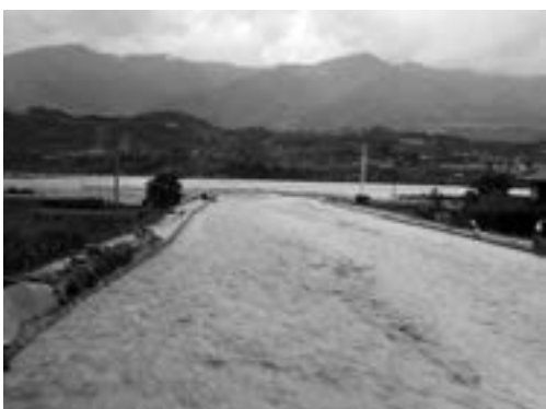
36災の上流からの大量の土砂と激流で、氾濫寸前の蛇川の様子(天竜川へ合流する付近)

中で、南信州地域振興局林務課林務係の担当係長が「二応調べてみましたら、二十五年度の三月五日に総代会において残土置場の決定をして村へ申請をしたということのようです。それで理事会ですとか総代会ですとかは、定款の方で決められたものでない(という)ことで、それは無効ではないかという判断で御座います。」と回答(六月十五日)をもらって確認できたことです。