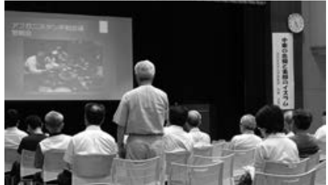
聴講者からは質問も

南信州の安穩で生活する私たちにとって、近世に由来する世界各地の混沌とイデオロギーの対立は、とも