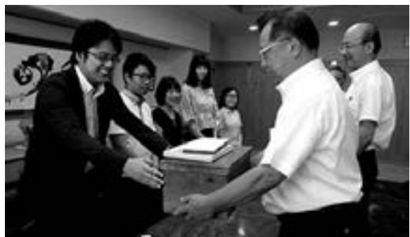
立正大学河野村研究会から村長へ

札、捨て子の処置など、素人目にも面白いものもあります。 村では、文書の寄贈を有り難く受け、資料館に保管すると共に、希望があれば閲覧を許可します。公民館または資料館にお申し込みください。 (資料館主任 唐澤武彦)