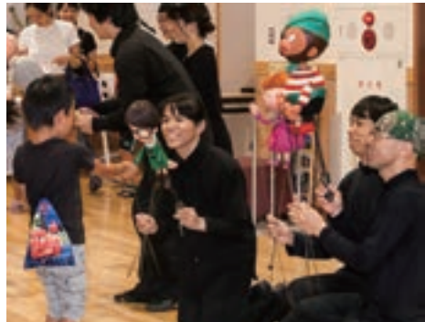
お馴染みのキャラクターがお見送り