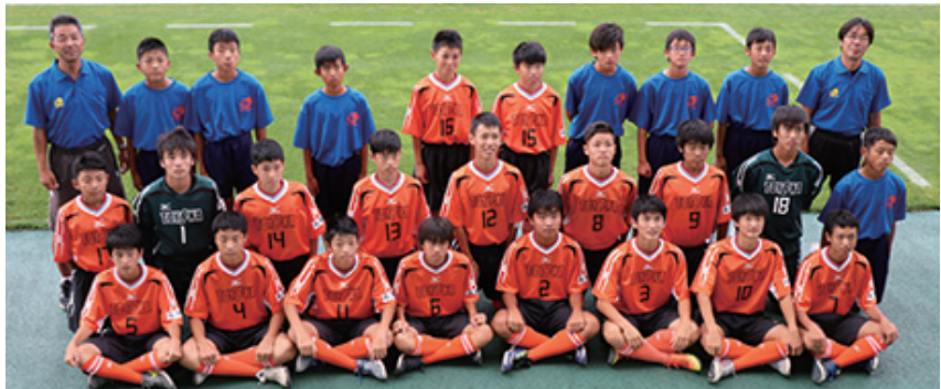
豊丘中サッカー部の精鋭たち