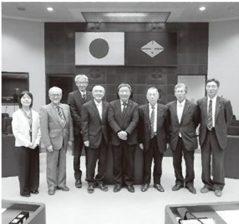
長生村議会の視察では、正副議長、議会改革委員会委員長及び事務局長に対応いただきました

「きそ保育園」では夏の猛暑が続く中、「子どもたちが安心して遊べる園庭を」とのことで、5年ほど前に設置したそうです。約4坪のメッシュ状のシェードを、ワイヤー3本で吊り、シェードとワイヤーは滑車をつながれていました。この構造とメッシュ状であることから、開け閉めはスムーズで、職員一人でも簡単にできます。朝7時半頃から午後4時頃まで使用しており、雨に濡れた時には乾かして収納しているそうです。設置後5年でもシェードの劣化は見られず、10年間は使用可能など、設置の効果は大いに期待できそうです。