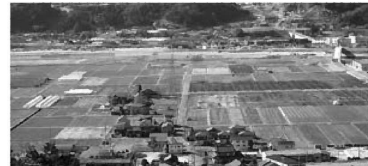
法人化の進む河野新田

質問 河野新田法人化による関連予算詳細な説明を。 回答 地域集積協助力金1,234万円を補正、今回は全額県からの補助事業による。 質問 エアコン設置事業の内容は。 回答 国県の交付金事業、生活保護受給世帯へのエアコン設置補助。 質問 クラインガルテン事業の地盤改良工事というのは建物のみか、周辺も行うのか。 回答 地盤調査の結果、軟弱地盤が分かった。南エリア改良工事、建物部分のみ。 質問 柵・網の補助金 200万円については希望が多かったという事だがその状況は。 回答 防護柵の設置希望が多くなり、1月末時点で昨年同時期21件だったのが現在27件。補助金ベースで170万円増、2月・3月分見込んで200万円増額。 質問 有害鳥獣報奨金不足額80万円の詳細は。 回答 1月末時点で昨年実績並みのため増額補正。現時点で鹿150頭、イノシシ75頭見込み。 質問 自治振興費の改修等不足