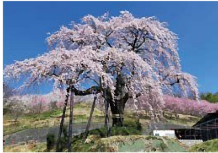
補強された笹見平の桜