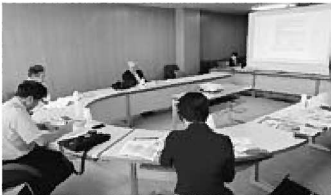
福井市役所にて林業政策を受講

在産加工所がないが、伐期を迎えた木材を伐り出すことから始めてはどうか。経営が望める山林を優先して意向調査と境界明確化作業を進め、森林整備に着手しやすい条件を整える。また、担い手確保のため、林業就業の前段階として、村外から人材を呼び込むワーキングホリデーの山仕事版を村に提案したい。