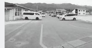
迎えの時間の駐車場の様子

3月13日(金)、保育園の迎えの時間に合わせて、駐車場の混雑具合を視察しました。議会だより前号で「とよまつみんなの声ステーションにいただいた声の回答」で、北保育園の駐車場についての対応を載せましたところ、さらにご意見をいただいたので、最も混雑される金曜日の迎えにあわせて様子を見にいきました。子ども課長、園長、建設環境課長、土木係長にも立ち会っていただきました。現在、家庭数53戸、(うち20家庭は長時間保育)。迎えの時間は20分間。駐車場は全部で35台分。(うち14台分は現在職員が使用)。いろいろな状況を見て、メジャーで計測を行うなか、どのようにすれば良いのかについて、委員会で検討していきたいと思います。