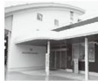
高森消防署新庁舎

南信州広域連合議会が2月に開催され、飯田広域消防高森消防署新庁舎での2月9日からの業務開始と、飯田・木曾消防指令センターでの4月1日からの運用開始が報告されました。地域防災の強化が期待されます。