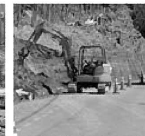
南入工事現場(壬生沢線)