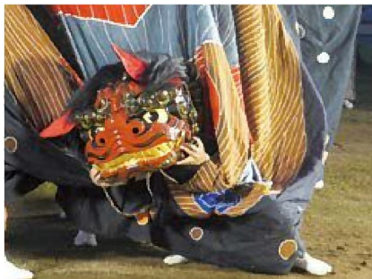
新調された獅子頭 (河野大宮神社春季祭典)