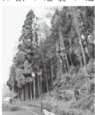
伐採適期を迎えた用材林

質問 現在、切り出された材木は加工材にも多く使われるよう、道路まで切り出して運べれば、集荷場まで運び全て販売することができるとのこと、ように、切り出す手間に何らかの支援を考えれば、だいたい手元に利益は残るようです。 一般的に考えれば、「個人財産に補助金を出すのか」と言われるものです。 しかし、味方を変えれば、先代の多くの方々が残した里山の用材林が、伐採時期を迎えても切り出せず、に、ただ住宅・農地・道路の日陰地となり、また獣の隠れ場となり、獣害や植物の繁殖に 質問 現在、切り出された材木は加工材にも多く使われるよう、道路まで切り出して運べれば、集荷場まで運び全て販売することができるとのこと、ように、切り出す手間に何らかの支援を考えれば、だいたい手元に利益は残るようです。 一般的に考えれば、「個人財産に補助金を出すのか」と言われるものです。 しかし、味方を変えれば、先代の多くの方々が残した里山の用材林が、伐採時期を迎えても切り出せず、に、ただ住宅・農地・道路の日陰地となり、また獣の隠れ場となり、獣害や植物の繁殖に 質問 現在、切り出された材木は加工材にも多く使われるよう、道路まで切り出して運べれば、集荷場まで運び全て販売することができるとのこと、ように、切り出す手間に何らかの支援を考えれば、だいたい手元に利益は残るようです。 一般的に考えれば、「個人財産に補助金を出すのか」と言われるものです。 しかし、味方を変えれば、先代の多くの方々が残した里山の用材林が、伐採時期を迎えても切り出せず、に、ただ住宅・農地・道路の日陰地となり、また獣の隠れ場となり、獣害や植物の繁殖に