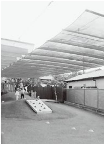
サンシェードの下では園児が伸び伸びと遊んでいました

豊丘村議会関東方面視察団では、令和7年10月28日と29日、行政視察を実施しました。視察地は東京都町田市の認定こども園「きそ幼稚園」と千葉県長生村の長生村議会です。「きそ幼稚園」ではサンシェードを利用した暑さ対策を、また、長生村議会ではハラスメント防止条例の制定経過について研修させていただきました。