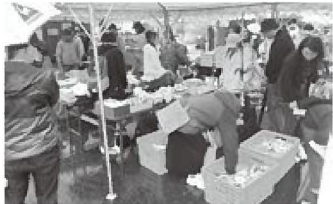
とよおかまつりでの「もったいない市」

ごみとして処分する」という事をきいたお年寄りが「親が一生懸命に働いて持たせてくれたものを、燃やすごみとして処分するのは悲しい」と言っておられた。和服や帯なども、ごみとなるのではなく「市」でリユースされるようにできないか。 また、この「市」がとよおかまつりのイベントのひとつとして定着しこれからも継続できるような考えていただけないか。行政が率先リユースを行うことについての考えを何う。 建設環境課長 和服、