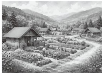
ラウベ（ドイツ語で「小屋」）

■ 議案第4号 滞在型農園施設設置条例の制定 令和8年8月使用開始予定のクラインガルテンの設置・管理を定めます。・名称：南信州豊丘村クラインガルテン 勝負平(南・北エリア)・構成：ラウベ付き農園、 附帯施設、交流施設・使用料：南(大型)年70万円/北(小型)年50万円・原状回復義務、敷金徴収を規定(総務産建委員会に審査を付託) 可決