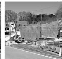
工事が進むクラインガルテン