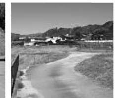
八王子住宅団地予定地