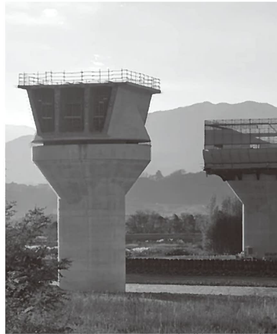
リニア中央新幹線 天竜川橋脚

村長 リニア開業が地域にもたらす利便性の高さを強調し、「空港並みのアクセスを持つ地域になる」との期待が語られました。東京圏の住宅価格高騰を背景に、地方への移住ニーズは確実に増えており、飯田地域で