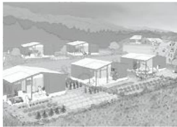
クラインガルテン（ドイツ語で「小さな庭」）

■ 議案第5号 国民健康保険税条例の一部改正 令和8年度税制改正および国の新日程を踏まえ、4月1日適用の税率改定のため条例を改正します。（総務産建委員会に審査を付託） 可決