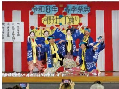
二十歳の舞 壮丁踊り