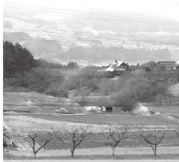
手入れされた農地、のどかな田園風景、ふるさとの魅力を永久に！

質問 村内の農家の世帯数はどのくらいか。 産業振興課長 販売農家が394世帯、自給的農家が278世帯で、合計672世帯。 質問 農家で、高齢者のみの世帯数は。 産業振興課長 販売農家394世帯の中で、65歳未満の専従者がいない世帯数は298で、75.6%。また、自給的農家278世帯