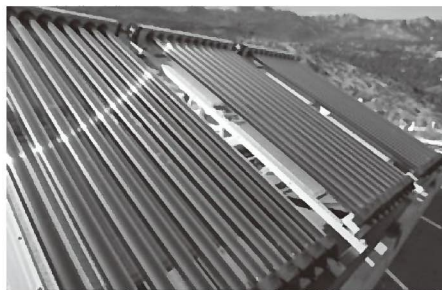
最新式の太陽熱温水器

質問 再生可能エネルギーの調査の中で、太陽光発電機や蓄電池購入補助が普及に役立つていることが分かりました。そのことを踏まえて質問します。 発電機の単価が下がったとはいえまだまだ高価なものです。以前から太陽熱温水器に太陽光温水器にも利点があります。 過去普及したものは「平板式」と言われるものです。風や外気に弱く冷めやすいため冬場に弱い。 質問 再生可能エネルギーの弱点がありました。各メーカーいろいろある中で現在は「真空式集熱器」方式のものがあり、魔法瓶のような管で集熱する構造のものです。 太陽光発電パネルは平均寿命30年前後。さらに最近では廃棄処分が問題も抱えている。太陽熱温水器は発電パネルより低価格。いろいろ調べてみると、メーカーによって違うのが通常の200ℓタンクで40万円前後でした。近隣では飯田市はじめ松川町、高森町、喬木村、大鹿村には購入補助がある。 豊丘村にはありません。補助制度が出来ないか伺います。 建設環境課長 高森町についてはエコキュートの普及から令和6年から廃止された。中川村では令和8年からの検討していること。標準的な工事費含む設置費用は300ℓから460ℓで88万円から120万円それに対する市町村補助は3万円から15万円です。クリーンエネルギーでもあるので検討を始めていきたいと考えています。