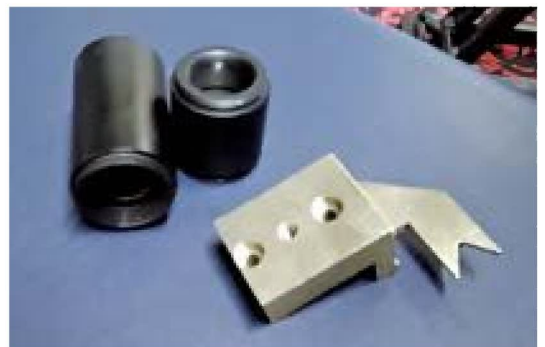
扱っている精密部品

ところに、以前より良くしていただいた方たちより、強い依頼があつて受けたという次第です。コロナ禍にこの地域の企業も大変だと聞いたので、何かお手伝いすることがあればと始めたものです。