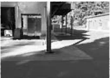
若狹町の焼却施設

目的 福井市の林業振興、森林整備、担い手支援のとりくみを担当主幹より詳細な説明と質疑に回答していた