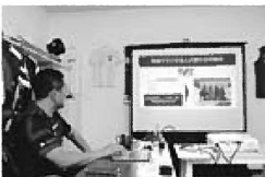
福知山ユナイテッドの先進事例を学ぶ

感想 環境に適合した施設と実感した。しかし、本村の、現状を変えての焼却処理については、経費・広域・埋設作業・環境面を含めた関係者との検討が必要と感じた。