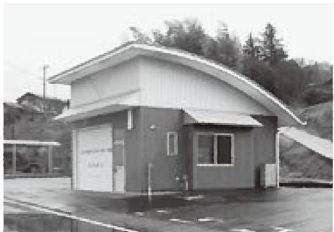
OB班の拠点となる旧1-1軽便詰所

うですけれども、人が集まらなくなりまして。そういう時代でございます。こういう消防団活動に参画していただいて、そのことによって地域との結びつきも深まりますし、仲間も醸成されます。地域にとって役立っている、役に立っていたりける人間の数を増やしている、そういう効果もあるんじゃないかなというのを思っておりますので、全力で応援させていただきます。