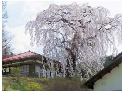
春爛漫 虚空蔵堂の桜 (木門) 3月29日、県外からも見学に訪れていました