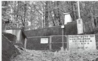
廃止予定の北入配水池