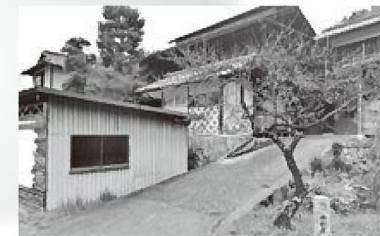
ゲストハウス井桁屋