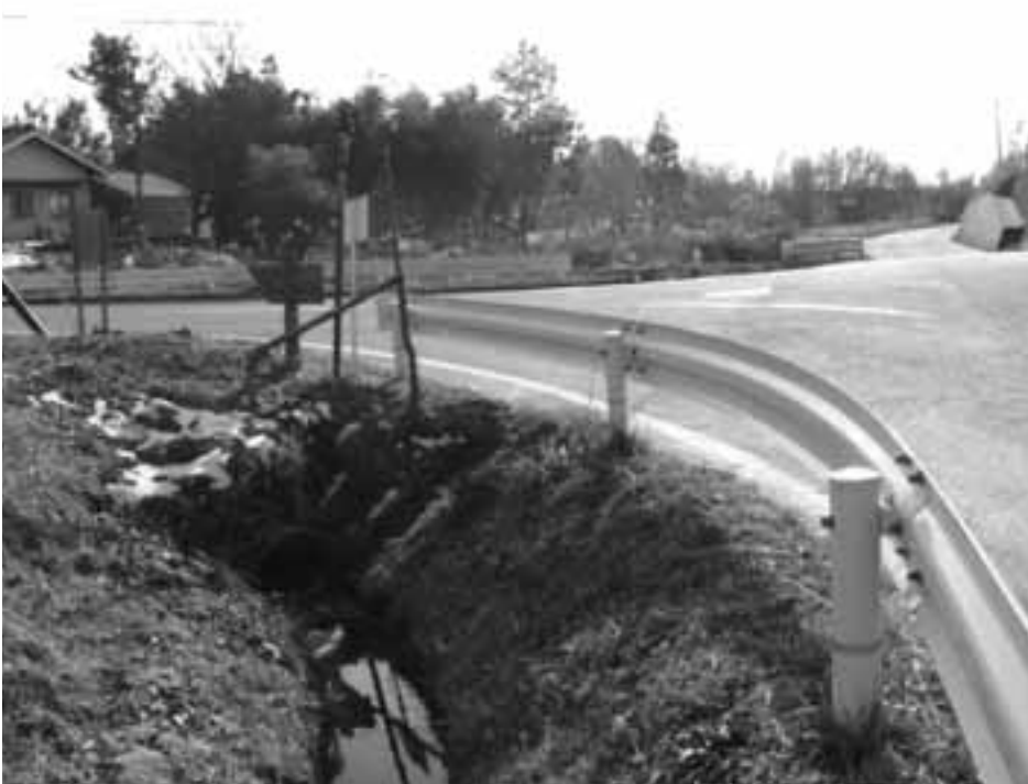
日向沢水路改修工事申請現場 (山田)

情書が提出され、継続審査となつていました。現実には十一月五日に村長がJAに対し正式に断りを入れ決着済みの案件ですが、陳情書が議会宛ての為、議会として判断を示す必要があり、全会一致で採択しました。委員からは役場の将来的な有効活用を様々な角度から探り研究して行く事の必要性も述べられました。