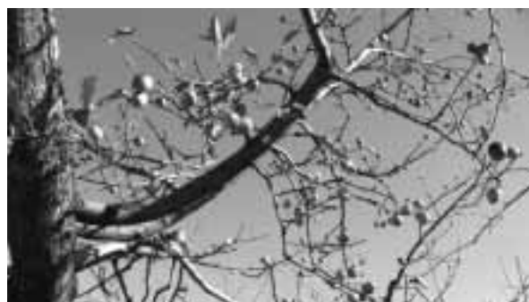
ひょう害により二度花が咲き実をつけたりんご

川野議員 ひょう害義援金については現在どのくらい集まっているか。また使い方についてはどこまで話し合われているのか。産建課長 十二月八日現在で、四百万余円ほど集まっている。その後もう少し増えていると思います。