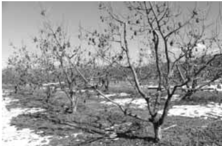
ひょう害により採り残された市田柿

要。 質問 県の支援と今後考えられる村の支援は。 村長 病害虫防除事業、樹体被害対策事業、被害果樹の対策事業、被害果実を埋めるための穴掘り重機の借り上げ料などで二百万円弱が県の支援で、村としては二十一年度以降も立ち直っていただくための支援をしたい。