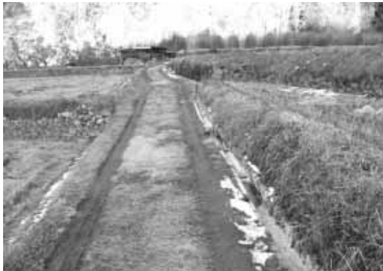
資材支給により整備された水路(伴野北入地区)

数はどのくらいか。 産建課長 十一月末で資材支給は四十三件申請されたものを完了しています。そのうち二十五万円以上が十五件あります。満額の三十万円は最近になって増えていきます。