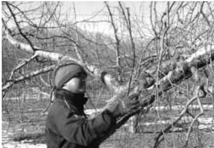
寒風の中での剪定作業

質問 現在五回まで無料にしている、飯田下伊那はどのも同様でさらに上乘せている所もある。舛添厚生大臣は