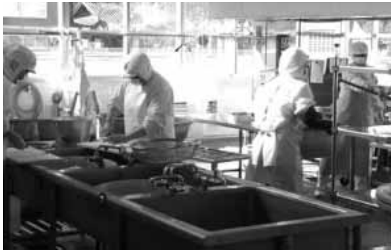
学校給食共同調理場

総務課長 村だけでは、なしえない事も想定されるので、広域や、国、県との連携をとりながら行動計画を立てていく。