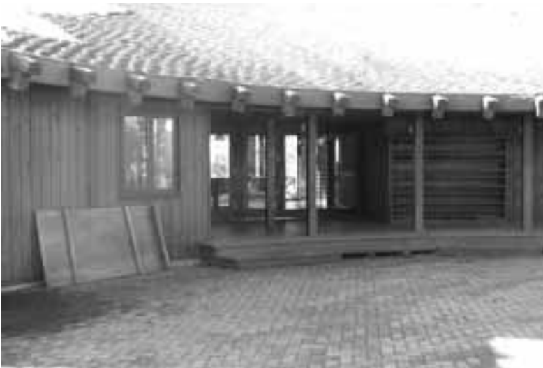
現在は使用されていないセミナーハウス管理棟