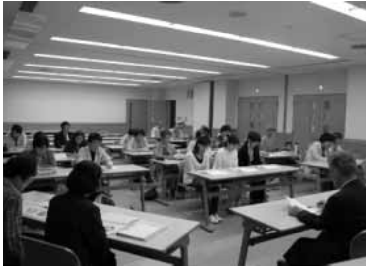
村づくりふれあい集会（女団連）

いるだけに思えるが。 村長 今年は地区会場に限らず女性団体、高齢者の団体、保護者会など懇談会の場を増やしたけれど、住民の90%も集まる自治会に、積極的に飛び込まなかった事も事実ですが、要請があればどこへでも行くというスタンスをとっております。 質問 このところリニアが話題となっております。Cルートでの早期実現を