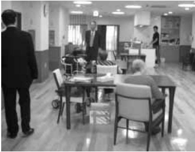
快適な環境の施設内部