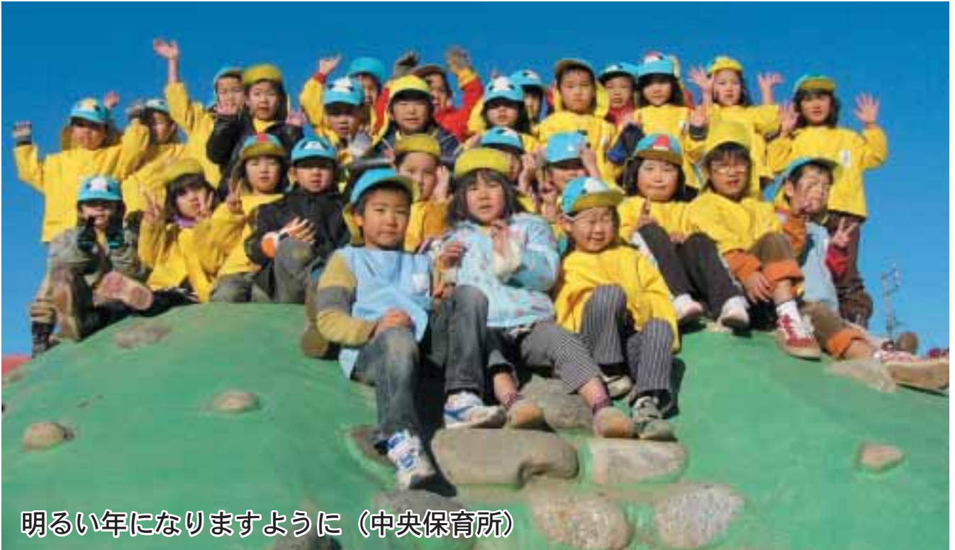
明るい年になりますように（中央保育所）