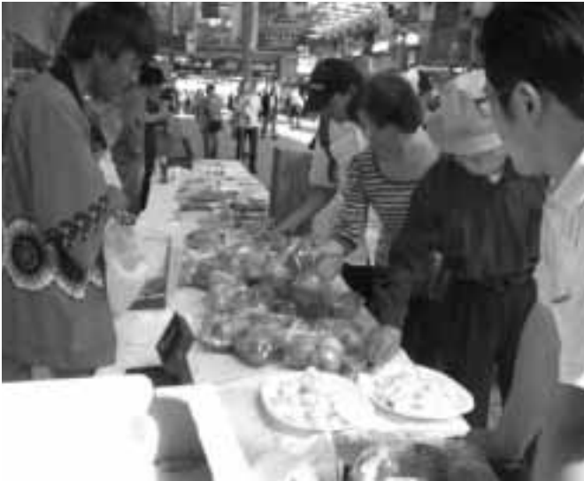
北部振興局の企画で行なわれた物産展(名古屋市金山駅前)

務や事業の可能な限りの広域的取り組みが必要と思うが？。 村長 共同事業は効率性の面で、問題とは違いもあり難しい面もあるが、北部振興局の活動が定着したので、可能な事業については積極的に声掛けを行なっていく。 総務課長 当面は防災無線のデジタル化や新型インフルエンザ等タイムリーなテーマを中心に、北部振興協議会の目的を充分果すべく、取り組んでいく。