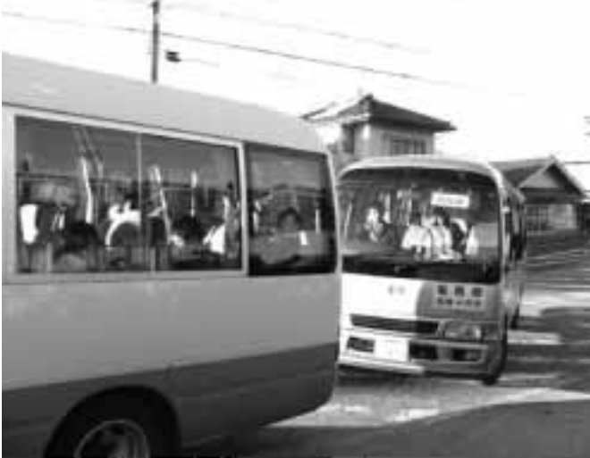
阿島循環線に接続予定の村営バス

質問 村営バスを阿島循環線に接続させる案は何の調査に基づいているのか、多分こうすればと言う程度での計画ではないか。