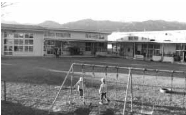
当面現状維持の南保育所

教育長 生活の基盤である家庭教育が生きる力の源となっており、本村が進める「早寝早起き朝ごはん」運動は、この生きる力の根本に座するものである。子供の成長には、第一に食べ物、第二に毎日の学習、第三に心の育成となる体験と、間接経験である読書が不可欠のものである。