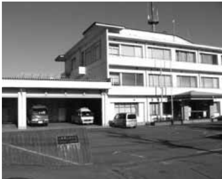
飯田消防広域本部

村長 ①長野県では東北信と中南信の二つの本部体制を検討しているが、拙速な議論はしないこととしている。広域化は平成二十四年度末を目指している。②飯田広域消防は、阿南と飯田を統合したばかりであり、それぞれの地域現場に合った装備と人員体制を図ってきている。 消防組織は現場を抱える地域に必要であり、広域化しても返って経費と負担がかかるという心配がある。 特定健診が義務化 受診率を高める施策を検討 質問 本年度から国民健康