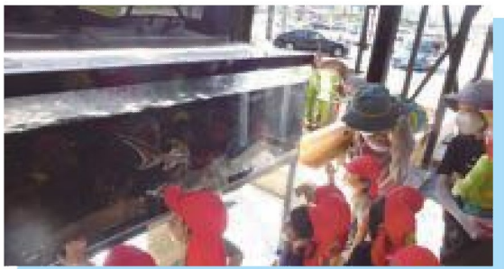
チョウザメ かっちよいい~!!