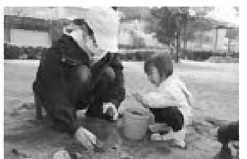
型に砂を入れてひっくり返して 「あら〜、楽しいねえ!」