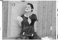
顔ヨガのおかあさん指導者

子育てサークル「このゆびとまれ」の活動で顔ヨガを行いました。サークルのおかあさんが指導者となり、顎すっきりヨガ、目ぱっちりヨガ、顔引き上げヨガを体験していました。普段、意識して顔の筋肉を動かしていないので、「意外に、難しい!」「これでいいのかなあ?」と鏡を見ながら、おかあさん同士で話したり笑ったりしながら、楽しく活動していました。