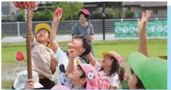
玉入れ、上手に入るかな~