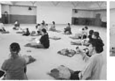
大勢のおかあさん達が参加