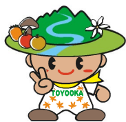
豊丘村キャラクター「だんQくん」