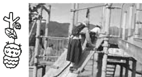
おかあさん子どもと一緒に チャレンジです。がんばれ〜!

*公園のお掃除をしてくださっている方と出会いました。地域の皆様が公園をきれいに管理していただいているのだなと感謝の気持ちでした。地域の皆様、いつもありがとうございます。