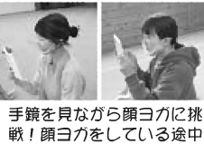
手鏡を見ながら顔ヨガに挑戦!顔ヨガをしている途中で「顔の筋肉が痛い!」と。効果抜群のようです。