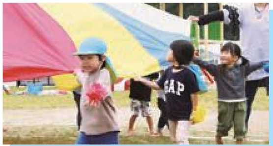
バルーン 綺麗だね!