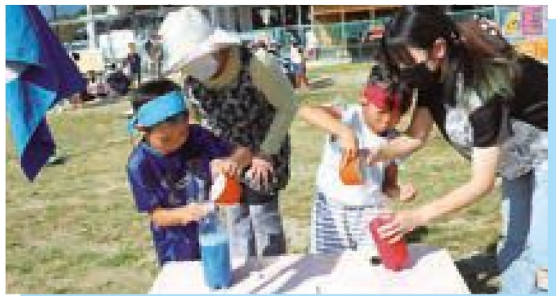
貯蓄りレー どっちもすごいぞ~