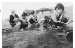
砂を掘ったりバケツに入れたり 砂場は人気の場所です