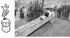
おかあさんと一緒にすべり台 「ローラーすべり台、早いね〜!」