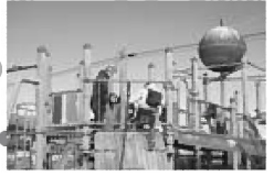
おおきなりんごが目印の公園 広くてきれいな公園です

ながよしチャレンジクラス(1歳〜3歳)の親子でりんごっ子公園に行ってあそびました。当日は朝の冷え込みが厳しく寒い日になるかと心配していましたが、太陽が出るとポカポカと暖かくなり、たくさん体を動かして親子で活動しました。手足でロープを掴んで登ったり、ローラーすべり台を滑ったりと親子でにこにこ顔。楽しい時間をおかあさんやお友だちと一緒に過ごしました。