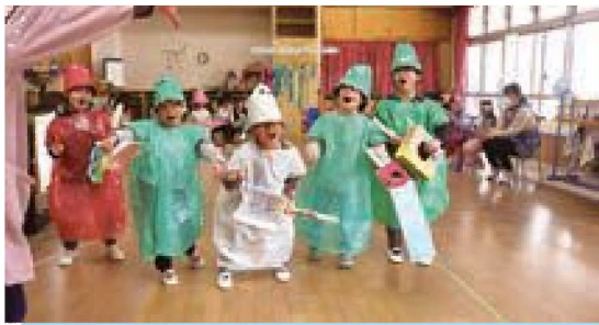
ゆりぐみファッションショー♡