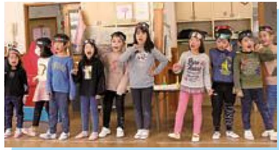
メラメラマンで1・2フアイヤー!