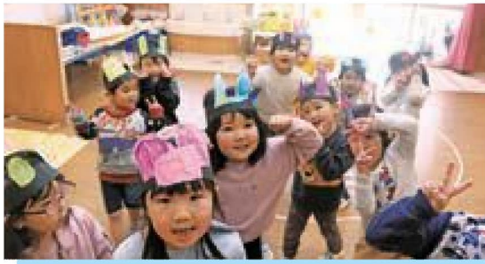
ねこのヒート、レッツエンジョイ♪