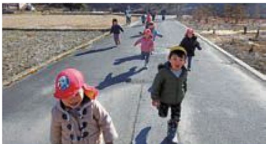
走るのって楽しいな♪