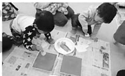
自分の思うようにとんとん作っていくおともだち 白いツリーにいろいろな色のスタンプやシールで飾りつけをしました

年に1度のおたのしみ! 2歳と3歳のおともだちとおかあさんが集まって、クリスマス会を行いました。「サンタさん、来るかな〜?」「サンタさん、どこから来るかなあ?」と期待をしながらサンタさんを迎える準備の飾りを親子で作りました。