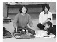
ベビーマッサージ