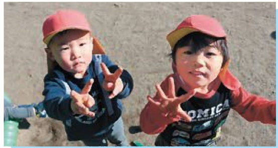
☆お外であそぶのだから〜いすき！