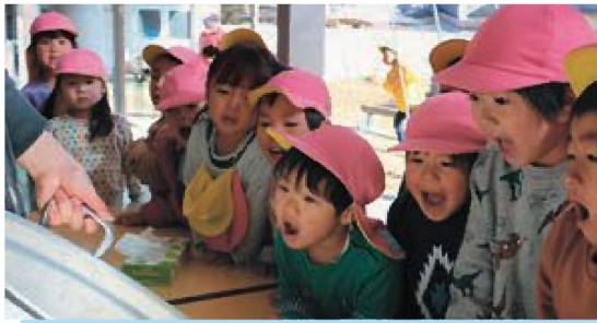
☆うわあ〜！さといもご飯おいしそう