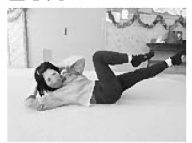
スレンダーピクス