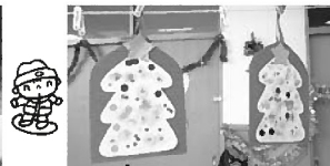
きれいなツリーの飾りができました 「サンタさん、見てくれるかな?」