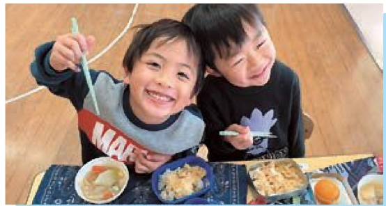
☆今年もいっぱい食べて元気いっぱい！