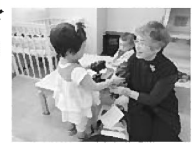
絵本の読み聞かせ