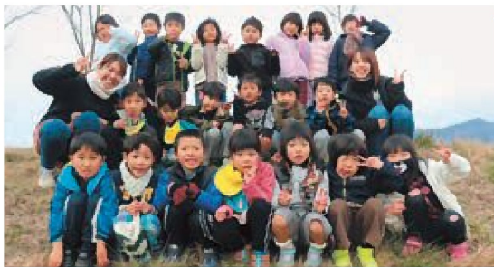
☆春になったらピカピカの一年生！