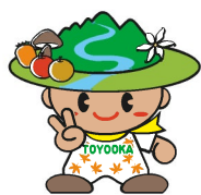
豊丘村キャラクター「だんQくん」