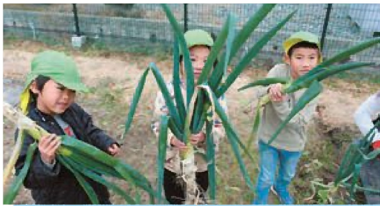
☆すっごい大きいネギとつたよ