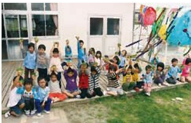
☆手作り柏餅おいし〜い♪