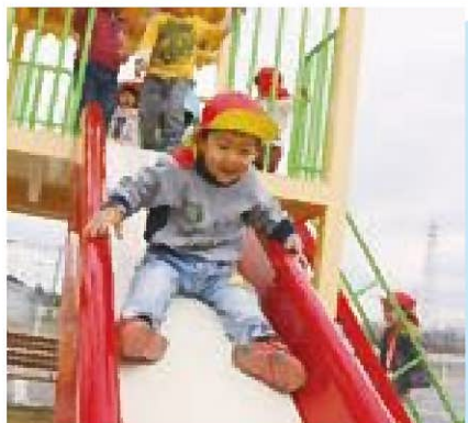
☆タイガーリリーのお家の滑り台たのしいな!