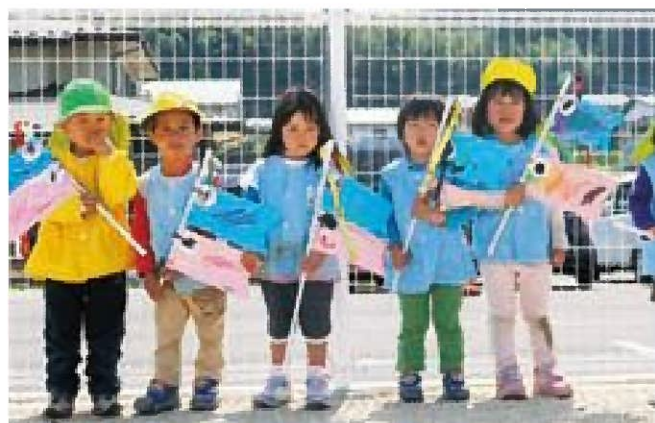
☆鯉のほり作ったよ!