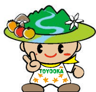
豊丘村キャラクター「だんQくん」