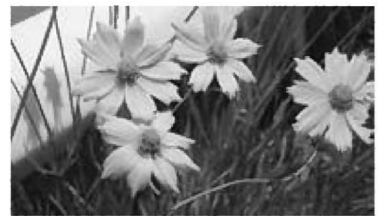
【オオキンケイギク】

5~7月頃にかけて、キバナコスモスに似た黄色の花を咲かせる「オオキンケイギク」を道端や天竜川などの河原でよく見かけます。キバナコスモスの方が花色が濃く、葉が全く違います。きれいな花だといって自宅の庭等に植えてはいけません。