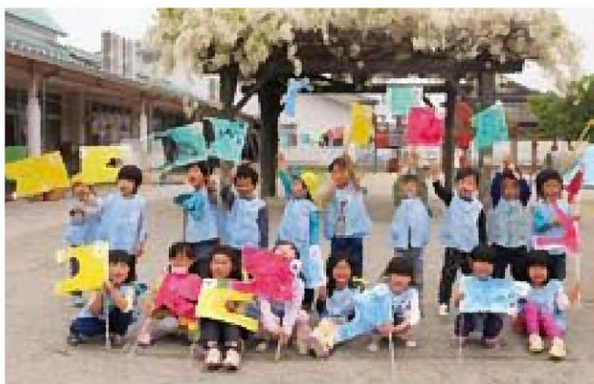
☆屋根よ〜りた〜が〜い自慢の鯉のほり