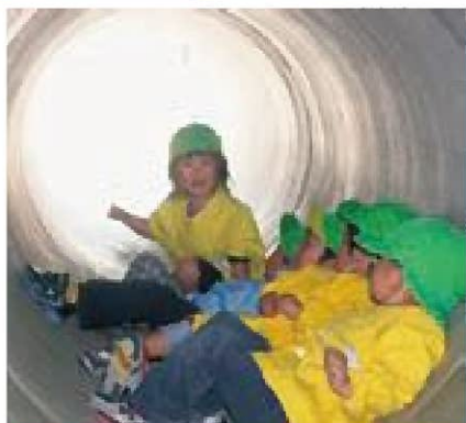
☆ひんやりトンネルきもちいい