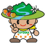
豊丘村キャラクター 「だんQくん」