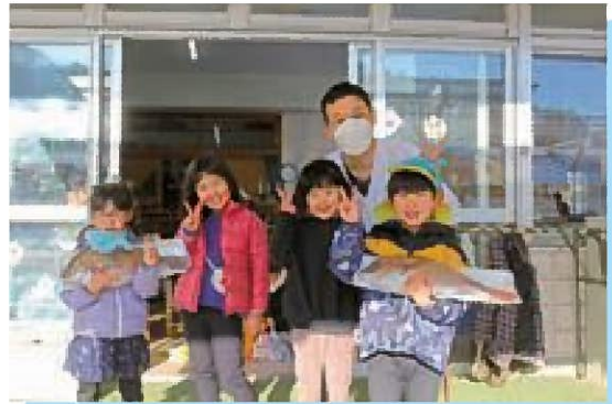
すこいよ!お魚解体ショー ✨