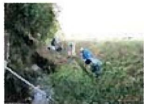
【集落共同の水路清掃】