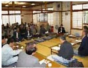
【集落での話し合い】