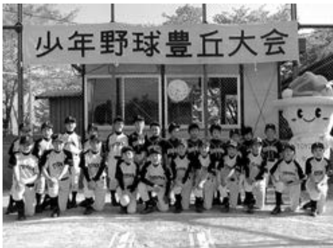
健闘した豊丘チーム

天気を心配することもなく五月二十一日、少年野球豊丘大会が行われました。開会式の選手宣誓は大丈夫だと思いましたが、すごく緊張してしまい間違えてしまいました。豊丘はシードで松川と戦いました。僕は七番で、打つ方は良いところが無かったけど、守備ではファールチップをよく取れたので良かったです。チームの打撃は好調で、六点取ってそこから三点取られたけど六対三で勝利しました。決勝戦では丸山と戦いま