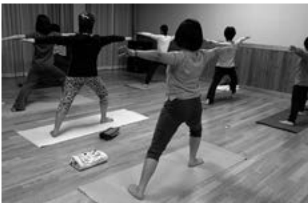
呼吸を意識してリラックス(英雄のポーズ)

主催:豊丘村・豊丘村教育委員会・豊丘村公民館・人形劇実行委員会 協賛:神稲建設(株)・飯田信用金庫豊丘支店・豊丘村経営者協議会