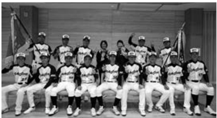
2つの県大会を制した豊丘48オールスターズ

また、五月に下伊那郡体 育協会功労者の表彰をして いただきました。このよう な結果が出ているのも、村 や体育協会の協力あつての ことと、とても感謝してお ります。 全国大会 は九月に静 岡県袋井市 などで行わ れます。初 戦突破を目 指して、ま た、おじい さんになっ てもこのヨ ンパチで試 合ができる ように、こ れからも仲 良く練習し ていきたい と思います。