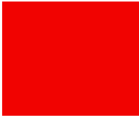
須恵器三足短頸壺

この壺は現在、県立歴史館の巡回展「長野県の遺跡発掘二〇一七」で県内各地で発掘された重要出土品と共に公開展示されています。実は、この展覧会には豊