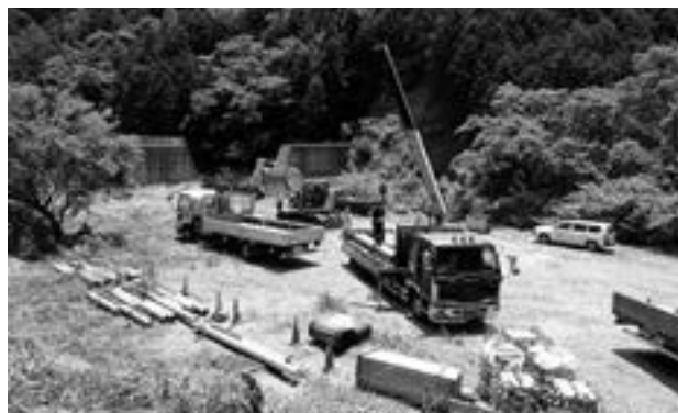
準備が始まった道路改良工事の資材置き場(日向山ダム付近)