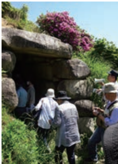
飯田市松尾 上溝天神塚古墳

年十月に国から史跡指定された六古墳群と、飯田市考古博物館を見学しました。とかく県内では北高南低と言われますが、古代飯田下伊那の地は、ヤマト王権と密接に繋がりに古代文化の栄えた地でありました。それを象徴するのが県内にあり、前方後円墳の約半数が飯田市内にあることです。前方後円墳はヤマト王権の影