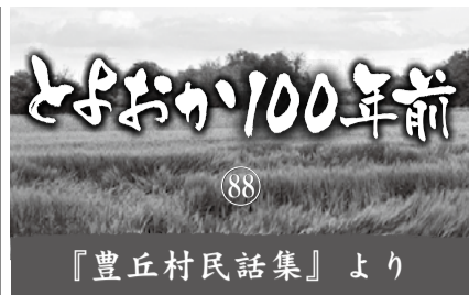
『豊丘村民話集』より