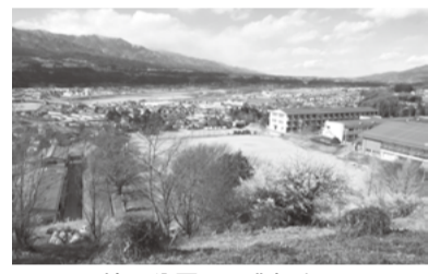
林原公園より眺望する

情にもよると思われる。 ◎一口メモ・南北に長く気候とか交通網によって細分化され県全体の一体感が希薄であったのを是正し、県内の地理教育の教材として明治三十三年に作られたよ