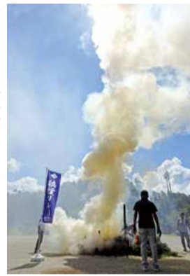
止となつてしまいましたが、今年度は最後まで全力で開催できるように多くの皆様の参加をお待ちしています。

毎年の恒例事業となった狼煙リレーは、今年も八月二十四日に村民グラウンドで開催予定です。本物の炎と煙で再現される古の伝達手段は、せわしない現代において歴史のロマンを感じさせてくれます。是非多くの皆様のご参加をお待ちしています。