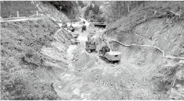
戸中下つ沢残土置き場工事

日本豪雨などで、たくさん崩壊しています。つまり蛇川上流での残土置き場建設で採用される方法は、実際にあちこちで被害を引き起こしている安全面から問題があるのです。