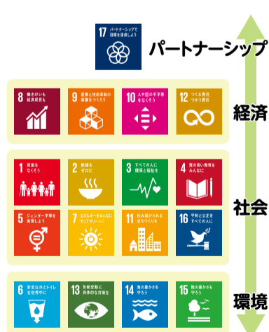
社会と経済活動の持続可能性は地球環境をベースに成り立つ

SDGs十七の目標の関係を理解するのにスウェーデンとインドの環境学者が提唱した「地球の限界」という概念が一番でした。環境(地球)があるからこそ社会・経済。(下図)この図の通り親亀である環境が崩れると、子亀もこけることになりそうです。