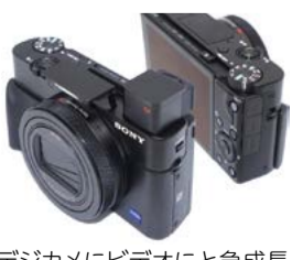
デジタルカメラにビデオと急成長している世界のソニーが人気。