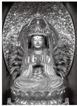
まだ幾つもの謎が残されていますが、豊丘にまた新しい宝物が一つ加わりました。大切に後世に伝えていきたいものと思います。 〔資料館主任 唐澤武彦〕

し、その上に小さな仏を載せている姿は、京都の清水寺の本尊と同じ姿をした、いわゆる「清水寺式」の千手観音です。一八世紀前半(江戸後期)に確かな仏所で作られたもので、寺に寄進されたのも同頃と考えられます。県内では幾つかの「清水寺式」千手観音が確認されていますが、飯伊地区では本像が初めてです。 全国にある清水寺と同名