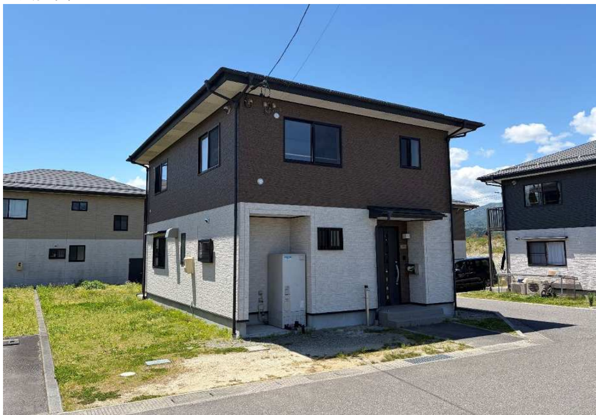
八王子2団地 204号棟の北東側