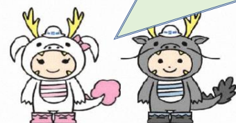
リュウコ 飛島・市川工務店工事共同企業体 イメージキャラクター リュウタ