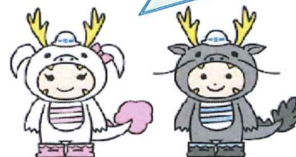
リュウコ 飛島・市川工務店工事共同企業体 イメージキャラクター リュウタ 飛島・市川工務店工事共同企業体 イメージキャラクター

リュウコ・リュウタです。 梅雨明けが待ち遠しくなってきました。 夏本番まであと少しですね。