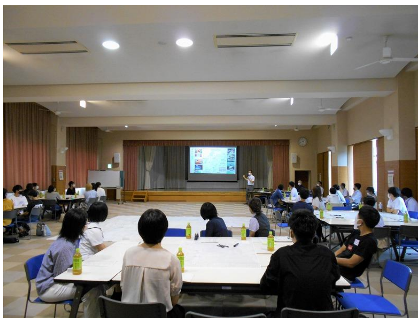
高校生等によるまちづくり座談会