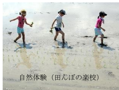
自然体験（田んぼの楽校）