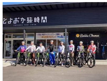
サイクリングイベント