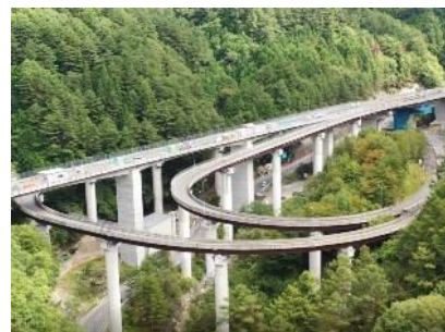
三遠南信自動車道 喬木 IC